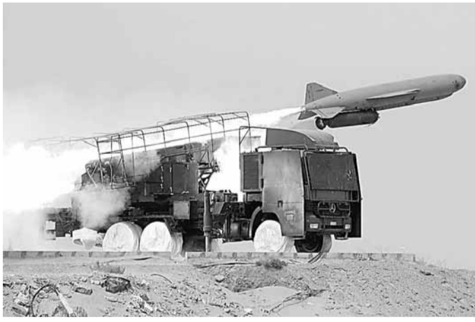
伊、沙關係緊張，可能導致直接軍事衝突。圖為伊朗去年試射導彈。