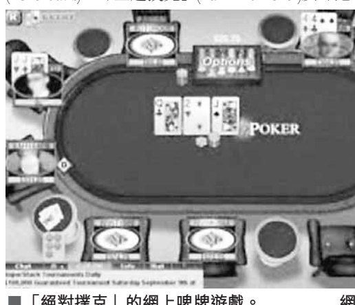
「絕對撲克」的網上啤牌遊戲。