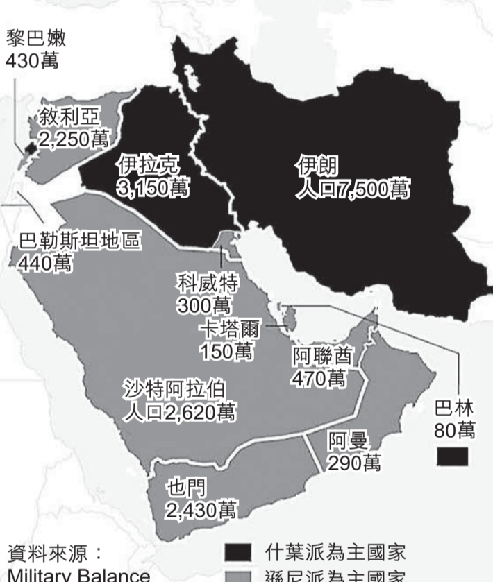
資料來源：Military Balance ■ 什葉派為主國家 ■ 遜尼派為主國家