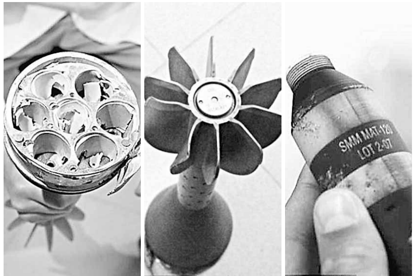
人權組織出示一個在米蘇拉塔拾獲的集束彈殘骸(左、中圖)。右圖為其中一顆彈藥。

利比亞激戰持續，反政府武裝和人權觀察組織前天表示，政府軍在西部重鎮米蘇拉塔的居民和醫院附近，最少3次發射國際禁用的集束炸彈，人權觀察譴責其行徑令人髮指，但利比亞政府否認有關指控。