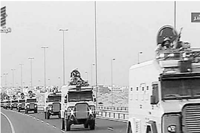
沙特上月派兵進入巴林，協助鎮壓示威。