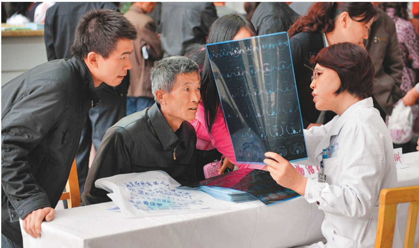
科學抗癌 16日,第17屆全國腫瘤防治宣傳周活動在山西省腫瘤醫院啟動,該屆宣傳周的主題是「科學抗癌,關愛生命」。圖為一位參加義診的醫生在接受市民諮詢。