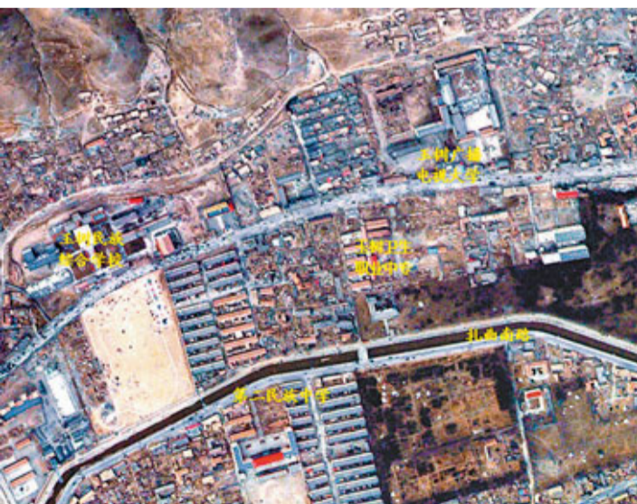
玉樹或更名結古市。圖為中科院遙感飛機影像顯示結古鎮西部地區房屋倒塌率達61.7%。資料圖片

香港文匯報訊 據《華西都市報》報道,記者從玉樹獲得消息稱,玉樹縣撤縣設市已成定局,新市名不是此前呼聲極大的「三江源市」,而是根據當地州縣兩級政府所在地結古鎮命名,即新市名最大可能為「結古市」。