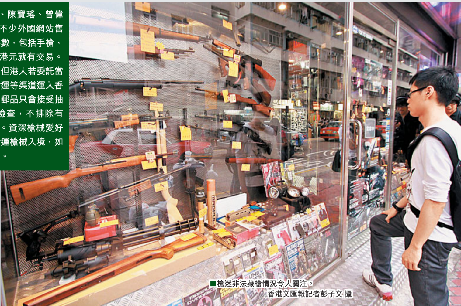
槍迷非法藏槍情況令人關注。

曾經持有槍牌、玩了兩年真槍的阿星指出，港人若要合法擁有真槍只有一個途徑，就是透過槍會購買。他希望槍械愛好者尊重法例，不要做違法的事。