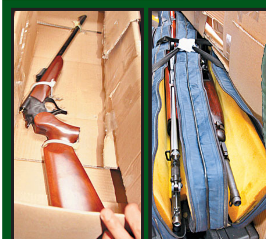
■0.22吋口徑來福槍走火，射傷老槍癡左腿。 ■探員取走的大批槍械中，包括火力強大的2枝長槍。