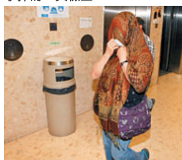
■公屋「軍火庫」的女戶主涉案被捕。