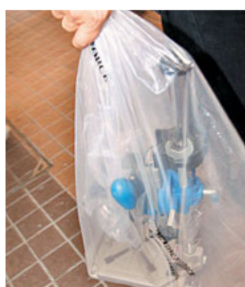
■探員取走部分疑用改槍及製造子彈的工具檢查。