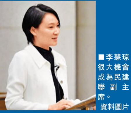
■ 李慧琼 很大機會 成為 民建聯副主席。資料圖片