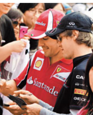
艾朗素(左)指仍難追趕身邊的維泰爾。

F1中国站將於周日展開，在澳洲和馬來西亞站均告失利的法拉利車手艾朗素昨日在上海坦承，現階段確難追趕已連贏2個分站的紅牛車手維泰爾。2屆世界冠軍艾朗素在開季首2站賽事分別只得第4名和第6名，至今仍未站上頒獎台，目前在車手榜以30分落後2戰全勝的維泰爾，對此艾朗素表示：「我時常也希望獲得勝利，但顯然現階段看來是未能趕及維泰爾的紅牛戰車。我們在中國站的目標與在馬來西亞時接近，希望在排位賽做出最好成績和在比賽時找到任何機會爭取佳績。」至於維泰爾的紅牛隊友韋伯則表示不擔心自己季初的慢熱表現，並明白到外界將他與維泰爾作比較實屬正常。