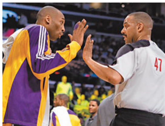
拜仁(左)哀多口惹禍。

高比拜仁在日前對馬刺的比賽中，因不服球證判決，被罰個人今季第15次技術犯規，而這名湖人球星其後還餘氣未消，怒砸座椅和狼摔毛巾，並以歧視同性戀者的言語侮辱球證亞當斯，結果周三被聯盟重罰10萬美元。