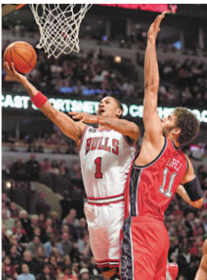
羅斯(左)今仗只有15分。