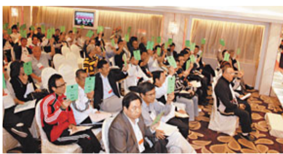
足總憲章改革獲一致通過。

香港文匯報訊(記者 郭正謙)「鳳凰計劃」闖過第一關！被視為鳳凰計劃起點的憲章修改建議，昨日在香港足球總會特別同人大會中獲得全票通過，足總會長霍震霆對各位足總董事在投票前的游說工作表示感謝，認為這是香港足球邁出的重要一步，而南華足主