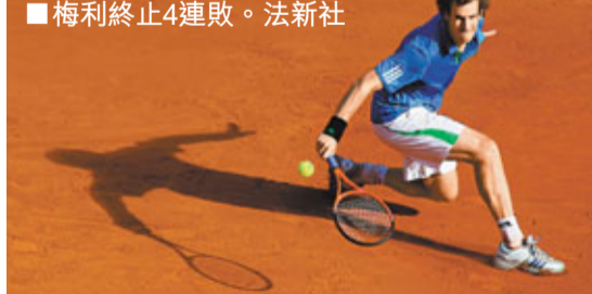
梅利終止4連敗。

力爭在這項賽事7連冠的拿度，在次圈晉級後則遇上法國球手加斯蓋特，賽後拿度說：「今天對我來說是一個美妙的開始，在場上的狀態比過去幾天訓練時的狀態都要好。」另外，4號種子、西班牙球手費拿在第3圈繼續過關，但5號種子的捷克球手貝迪治則以總盤數0:2負克羅地亞球手盧比錫出局。