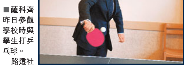
■薩科齊昨日參觀學校時與學生打乒乓球。

薩科齊的一己私慾引來當地居民不滿,去年薩科齊與妻子在該處度假,鄰近的海灘及海濱長廊亦得關閉。薩科齊早於2008年便曾在當地設禁飛區,但未有阻止攝影師拍照,這次實行了一百了,在他的別墅上空3,000呎範圍飛行的機師,會被罰款4萬歐元(約44.8萬港元)或坐牢6個月。 ■《每日電訊報》