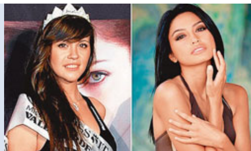
■坦尼斯(左)和巴蒂拉娜。

意大利法院繼續審訊總理貝盧斯科尼(右圖)嫖妓案,司法消息人士前日表示,檢察官周一盤問了2名曾參加老貝色情派對的少女,她們指這些派對比此前披露的更淫亂,在派對期間,老貝命袒胸露背的女孩表演為雕像口交。