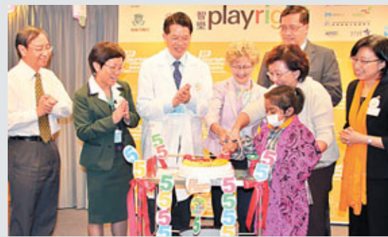
■瑪嘉烈醫院智樂遊戲台為目前全港唯一醫院遊戲互動電視台,每月邀知名人士與病童遊戲。