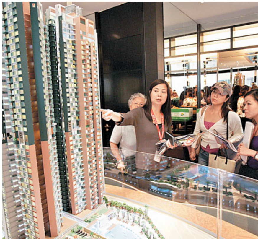
■調查顯示,市民近期置業信心續跌,與銀行加息及日本核災難等國際事件有關。

但他認為,消費者對個別經濟活動並不太悲觀,尤其是對日常消費品和非經常性大額消費,「雖然消費者對日常消費品和大額消費的預期變差,但剔除上一季度聖誕及新年的消費高峰期因素,把這次日常和大額消費的調查結果與過往數值比較,變化不大」。