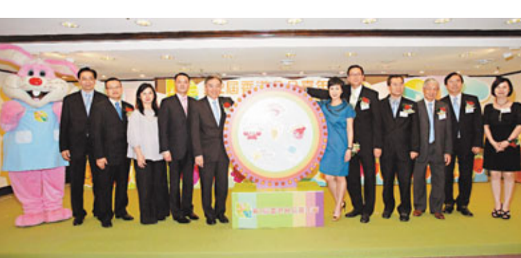
嘉賓出席「第2屆香港食品嘉年華」發布會。

及九龍城區的交匯點,交通設施齊全,亦是本地極受歡迎的年青市場場地之一。 首辦親子廚藝大比拼 配合嘉年華在復活節期間舉行,該會還籌辦一連串適合一家大小的節目,包括名人名廚烹飪示範,參與嘉賓包括:署理商務及經濟發展局局長蘇錦樑、「美食大使」蘇玉華、星級名廚余健志及名人坊高級粵菜大廚鄭錦富等。另該會將首次舉辦「親子廚藝大比拼」烹飪比賽,邀請全港家庭參加,透過烹飪比賽及遊戲,培養新一代入廚興趣,並拉近兩代或三代之間的距離。 出席昨日新聞發布會的嘉賓尚包括:廠商會副會長兼