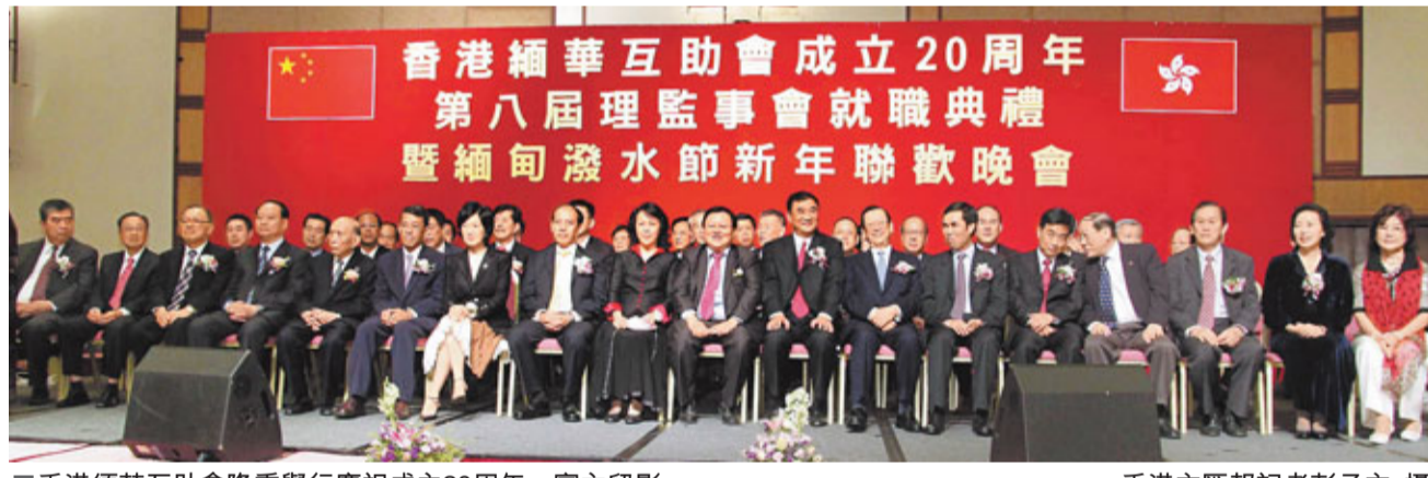
香港緬華互助會隆重舉行慶祝成立20周年,賓主留影。