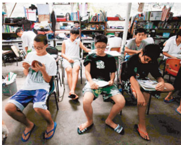
正生可以用短期租約形式,在芝麻灣原校址附近兩幅共5,000平方呎官地搭建臨時校舍,最快明年9月可使用。圖為該校學生上課環境。資料圖片

陳兆焯預計,臨時校舍建築費用須3千萬至4千萬元,校方會負責1/5費用,即約600萬至800萬元,未來有需要進行籌款。而正生稍後會申請禁毒基金,以支付其餘興建費用。對於建築費高昂,陳兆焯解釋,由於建築物料需要船運,地基不平等原因,令工程費用比一般建築高25%。他表示,臨時校舍只屬過渡方案,未來會繼續爭取遷校,期望在5年內遷往永久校舍。