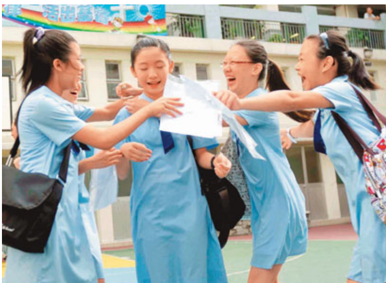
共有200間中學落實於今年9月減班,令全港中一學額「大執位」,也讓入讀英中「爭崩頭」情況更加激烈。圖為過去升中派位放榜時情況。

香港文匯報訊(記者 任智鵬)共有200間中學落實於今年9月減班,令全港中一學額「大執位」,入讀英中「爭崩頭」情況更激烈。雖然今年小六生人數較去年下降,僅不足5.8萬人,但最新《中學一覽表》顯示,供分區派位選校的英中學額,今年大減近2,000個,至9,638個,令派位英中競爭比去年5.4爭1,上升至6爭1。不同地區學額與學生減少也不平均,致跨區派位情況激增,以北區為例,跨區往大埔升中的學額,由去年50個增加3.8倍,至240個。學界提醒家長,為子女選校時,除了須了解更多跨區校的資訊外,填寫志願也不要過於進取。