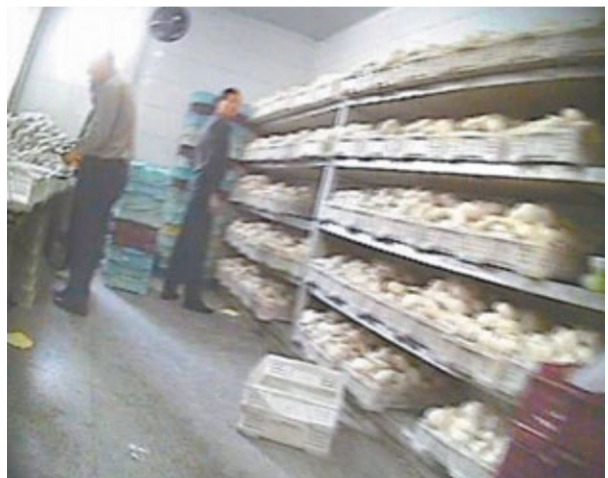
上海多家超市被揭發銷售「染色饅頭」。

香港文匯報訊(記者 張一波 上海報道)自被央視曝光後，上海「染色饅頭」事件繼續發酵。繼吊銷上海盛祿食品有限公司生產許可證後，有關部門已刑拘5名嫌犯，案件目前正在進一步審理之中。