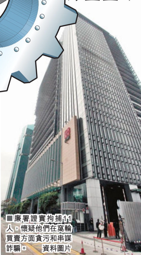
廉署證實拘捕11人，懷疑他們在窩輪買賣方面貪污和串謀詐騙。

業內人士指出，是次事件，部分環節相信是參考09年的香港投資網事件，涉案人同樣是涉嫌行賄造市。當年廉署控告香港投資網兩個主腦，涉嫌窩輪買賣串謀詐騙。在05年至08年間，上述二人串謀他人分別向東方匯理、花旗、標準銀行亞洲、德利佳華證券的多名人員賄賂，以圖低買高賣獲利。去年4月涉案人士罪成，兩主腦分別被判入獄3年及4年。