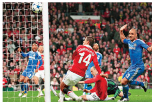
小豆(中)近門射入。

車仔今季料將顆粒無收，對於球隊與自己的前途，安帥說：「己隊表現不差，但曼聯更配得上晉級。我們很失望，但這就是足球，我們要向前看。我不該考慮自己的工作，我需要全力以赴。」