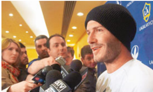
碧咸暫時無意退役。

由於碧咸狀態一直穩定，因此有人猜測他會繼續留下踢波還是會重返水平更高的歐洲賽場。英超熱刺主帥哈利列納就曾表示，對簽下碧咸很感興趣。不過，碧咸的傷病問題也不容忽視，去年初，他被租借效力意甲AC米蘭期間受到重傷，無緣南非世界盃，並缺席了銀河隊大半年比賽。