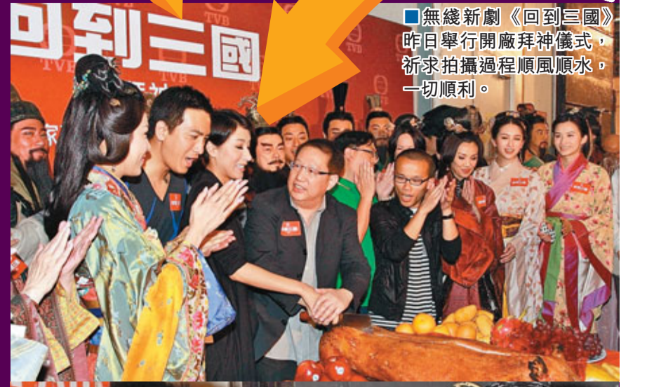
無線新劇《回到三國》昨日舉行開廠拜神儀式，祈求拍攝過程順風順水，一切順利。