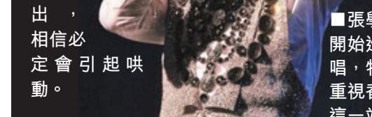
張學友開始巡迴唱，特別重視香港這一站。

此外，學友對今次香港區的巡迴站十分重視，舞台設計與其他站不同，要重新搭建，其中一項特別之處，是他幾乎零距離接近觀眾演出，相信必定會引起哄動。