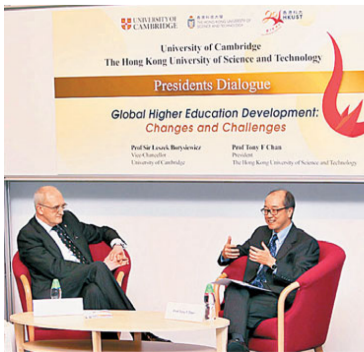
■劍橋校長Borysiewicz(左)與陳繁昌昨於科大就高等教育問題交流意見。

任詠華表示,獎項對她及學生均帶來很大鼓舞,提醒他們不要輕言放棄,才能克服科研路上的種種挫折,取得傑出成就。她盼望日後能研發出國際公認的香港原創科研成果。