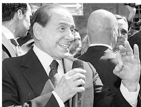
貝老前日在米蘭法院外，向支持者發表演說。

身陷嫖妓鬥醜聞的意大利總理貝盧斯科尼前日表示，自己確實給過藝名「魯比」的摩洛哥籍肚皮舞孃羅格6萬歐元(約67.6萬港元)，但這筆錢是為了讓她購買激光脫毛儀器，以開設自己的美容院。他強調這樣做是為了讓魯比「從良」，並不是為「性交易」而埋單。