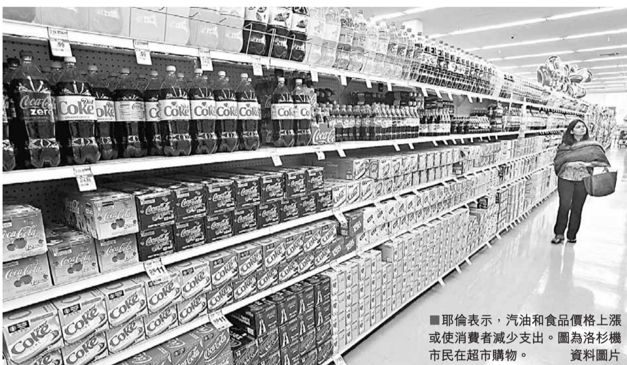
耶倫表示，汽油和食品價格上漲或使消費者減少支出。圖為洛杉磯市民在超市購物。 資料圖片

到訪東京的紐約聯邦儲備銀行行長達德利也認為，商品價格上揚可能只屬短期現象，毋需對通脹升溫過度反應。 ■《華爾街日報》