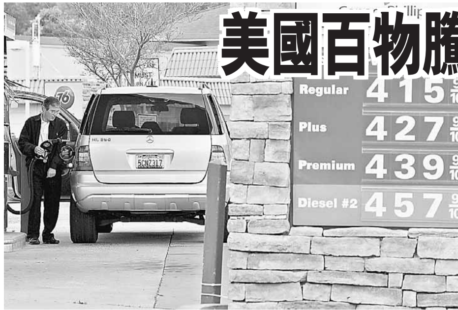
油價持續上升，下月底或衝擊每加侖5美元大關。圖為加州一間加油站。

油價高企不下，國際能源署(IEA)昨日表示，高油價或導致全球經濟放緩。美國不少民眾正為通脹上升做好準備，開始囤積食品甚至汽油，以免日後花更多錢購買。