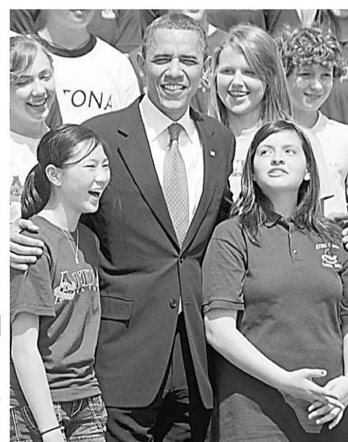
奧巴馬前日與一群中學生合照，笑容可掬。

美國總統奧巴馬今日公布減赤大計，以解決逾1.4萬億美元(約10.9萬億港元)的赤字。最新民調顯示，僅19%受訪者表示強烈支持奧巴馬，創新低紀錄，而認為奧巴馬施政表現不合格的人則佔40%以上。