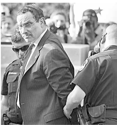
華盛頓警方前日拘捕格雷(左)。

美國首都華盛頓前日有150人上街示威，抗議民主、共和兩黨就2011年聯邦預算案達成協議，削減開支380億美元(約2,954億港元)，市長格雷亦參與示威，後來包括他在內有41人被警方拘捕。