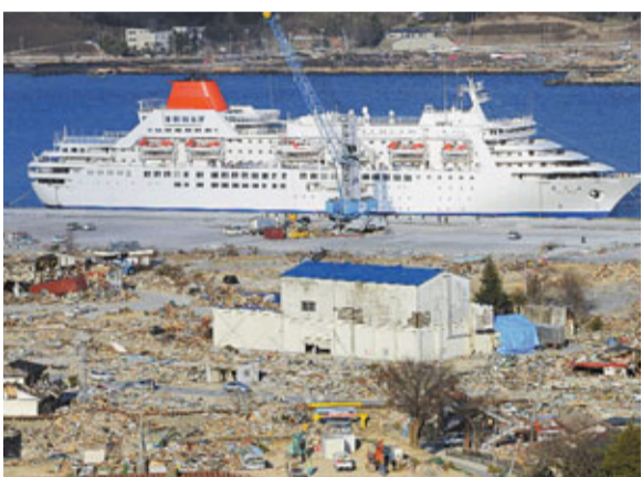
日本「富士丸」郵輪停靠在岩手縣的大船渡市，預計可收容約一千名災民暫住。

日本調升核事故級別，亦令商品市場有沽壓，市場憂慮全球原油需求可能回落，令石油股受壓，當中有上游業務的油股跌幅較顯著。油價由每桶113.46美元的高位，回落至每107.87美元。中海油(0883)全日跌2.89%，中石油(857)更大跌4.86%，下游業務的中石化(0386)只跌1%。