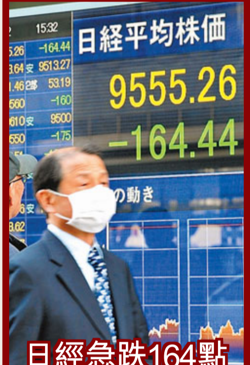
日經急跌164點 匯率急升

日本政府昨日將福島核危機升至最嚴重的7級，加上再發生強烈餘震，打擊投資者信心，日經指數昨日大跌164點，收報9,555點，跌幅1.69%，其中出口股為重災區。日匯急升，兌美元從昨日早段的84.78一度急升至83.50，其後回落至83.90日圓；兌歐元亦由122.10升至120.24。