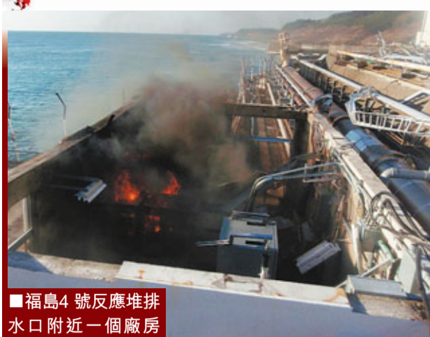
福島4號反應堆排水口附近一個廠房昨日起火。自衛隊滅火後無法確定火災原因。路透社

福島核事故至今已1個月，危機有增無減。日本《讀賣新聞》揭露了東京電力公司的反應如何緩慢，以致情況一發不可收拾，而政府的危機處理能力也嚴重不足，當局初期無法及時向美國提供核事故準確信息，又一直拒絕美國援手，令美國「乾着急」。有日本國會議員曾經警告，華府對日本的處理手法日益不滿，日美同盟可能徹底崩潰。