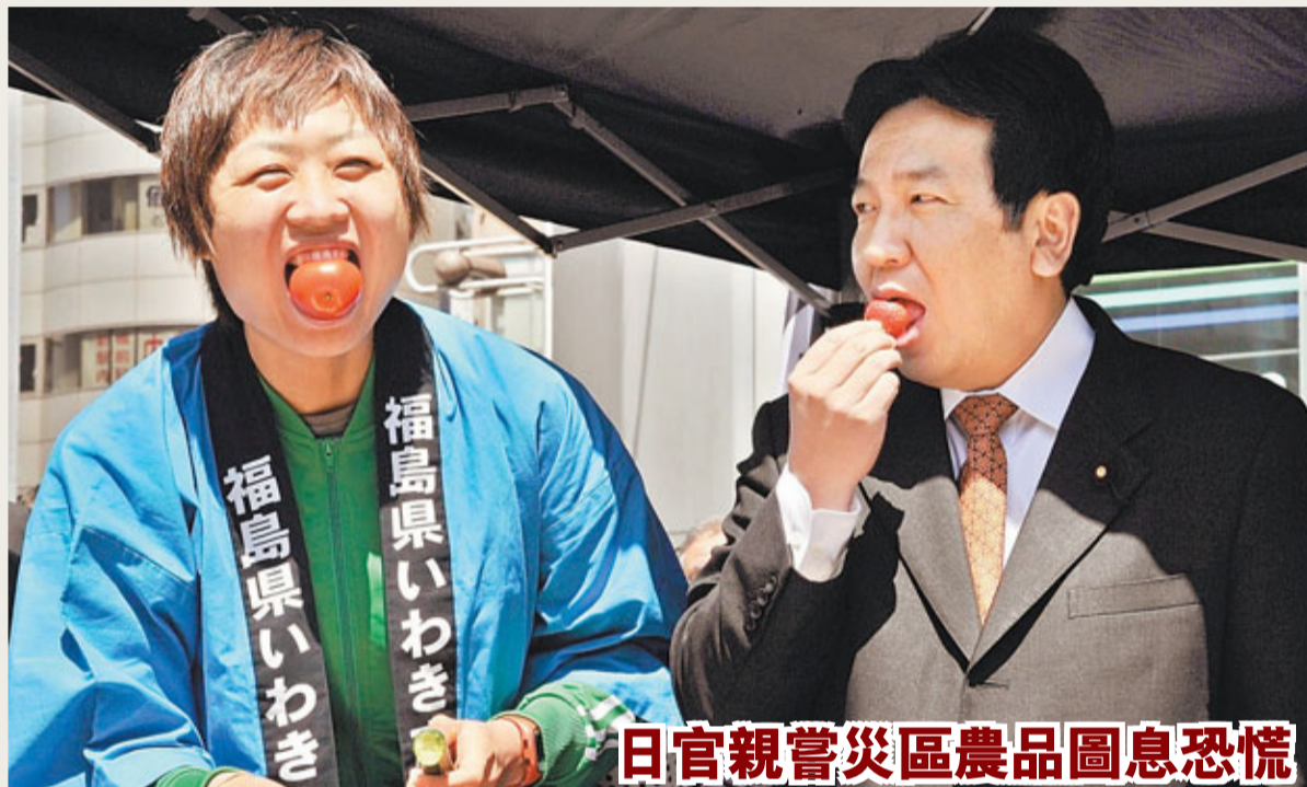
日官親嘗災區農產品圖息恐慌

日本內閣官房長官枝野幸男(圖右)與一名喜劇演員，昨日上午現身正在東京新橋站前舉行的福島縣警城市農產品展，親身品嚐草莓和西紅柿，宣傳產品的安全性。枝野強調：「上市銷售的所有食品都是安全的，希望大家通過消費支持災區。」