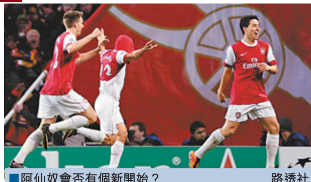
阿仙奴會否有個新開始？