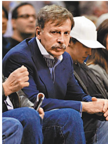
高恩基將會全面收購阿仙奴。美聯社