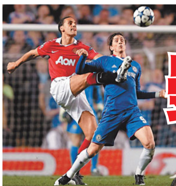
李奧費迪南(左)嚴防費蘭度托里斯。