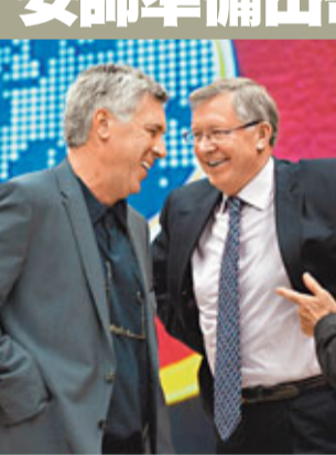
費格遜(右)與安察洛堤都是當今足壇的著名教練。

車路士領隊安察洛堤賽前坦言，自己今仗會出奇招，他說：「我會把首回合的比賽翻看1、2甚至3次，我必須做好準備，讓球隊能夠給曼聯製造麻煩。我們今仗會嘗試一些特別的東西。」他續說：「曼聯現在有優勢，肯定會嘗試防守反擊。他們的防線相當不錯，所以我們想入球也並不容易，但至少要有90分鐘全力以赴。」