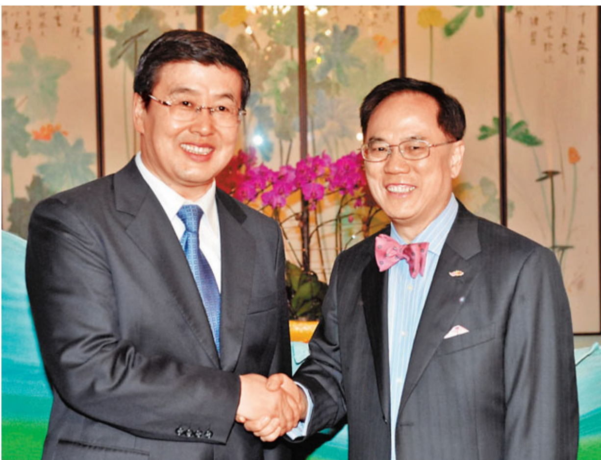
■香港行政長官曾蔭權(右)歡迎內蒙古自治區主席巴特爾到訪香港。

據了解，內蒙古此次在港招商累計正式簽署新型建材加工、風力發電、物流、有機農副產品綜合加工等多個領域的14個項目，總金額105億美元。與此同時，蒙港還簽署包括促進承接產業轉移和發展合作，促進雙方經貿合作備忘錄、旅遊合作框架協議以及金融合作備忘