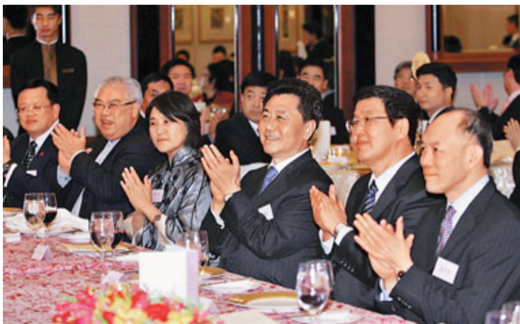
■中聯辦副主任李剛出席香港各界青年領袖歡迎內蒙古自治區代表團晚宴。

香港文匯報訊(記者 解玲)香港各界青年領袖昨晚假港島香格里拉酒店設宴歡迎內蒙古自治區主席巴特爾率領的代表團。中聯辦副主任李剛，全國青聯前副主席、全國人大代表霍震寰等嘉賓出席。 香港各界青年領袖透露將盡早組團赴內蒙古參訪，探尋商機、長續友情。宴會上，賓主逾120人共聚一堂，暢敘友情，並互贈當地特色紀念品，冀兩地於經貿合作、青年交流等方面共創新天。