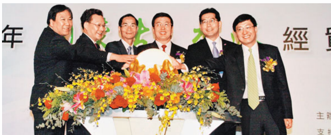
■左起：外交部駐港特派員公署副特派員李元明、內蒙古自治區常務副主席潘逸陽、中聯辦副主任黎桂康、內蒙古自治區主席巴特爾、香港特區政府署理商務及經濟發展局局長蘇錦樑和香港貿發局總裁林天福為2011年內蒙古-香港經貿合作活動周開幕式啟動按鈕。

香港署理商務及經濟發展局局長蘇錦樑昨日亦在開幕式上致辭時表示，近年來，內蒙古除發展