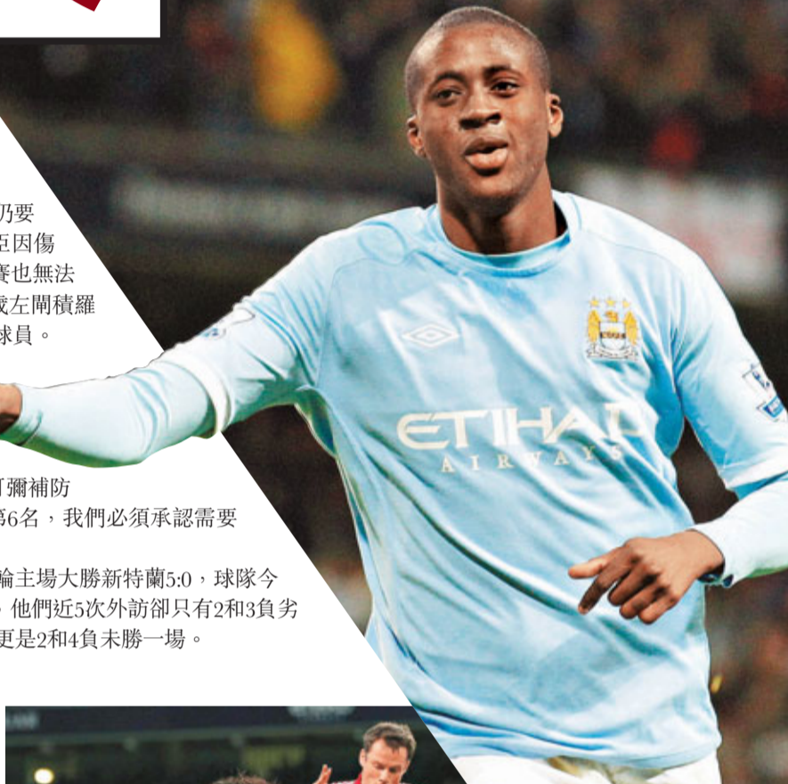
■曼城中場耶耶托尼擅守能攻。