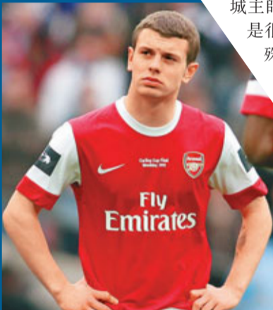
■韋舒亞炙手可熱。