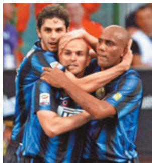
■甘比亞素(中)與馬爾干(右)各入一球。