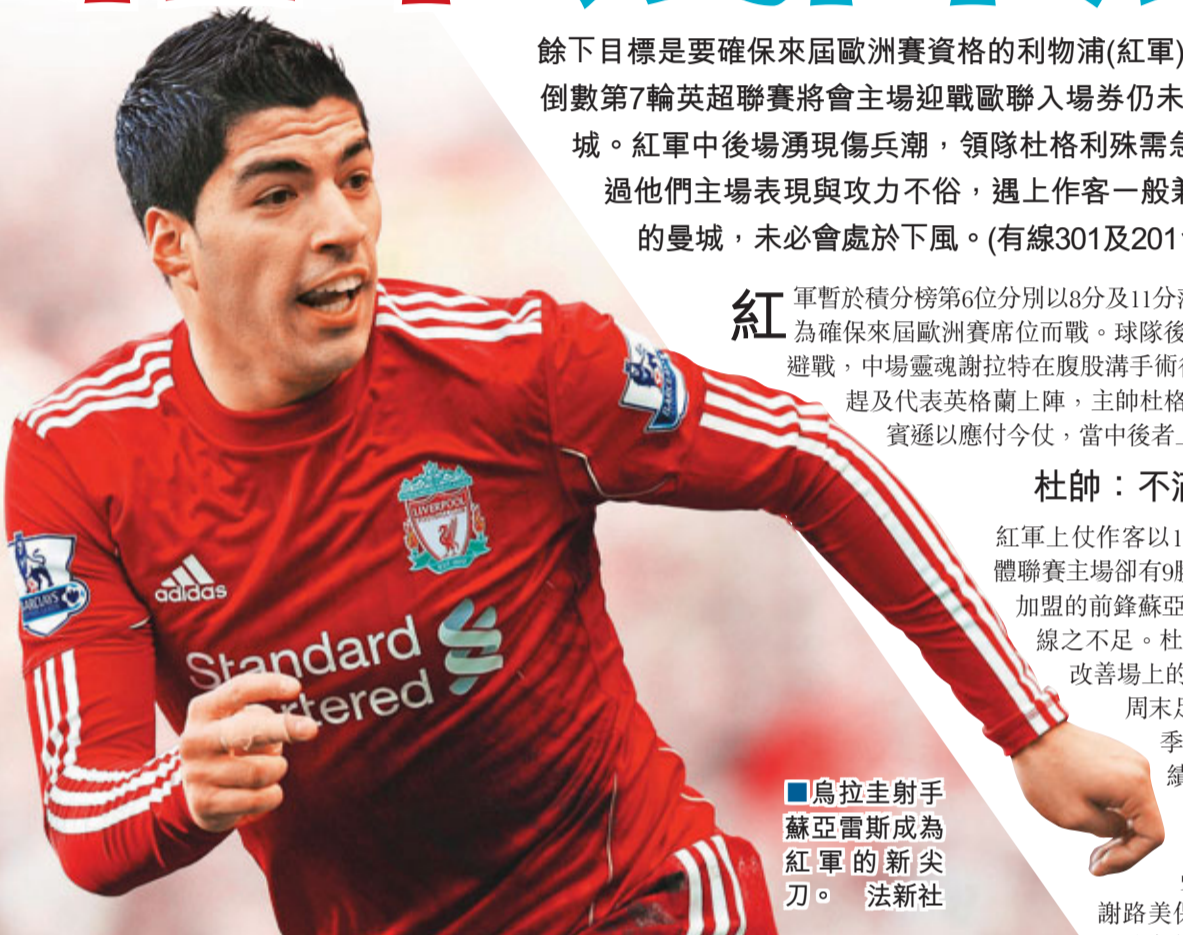
■烏拉圭射手蘇亞雷斯成為紅軍的新尖刀。法新社