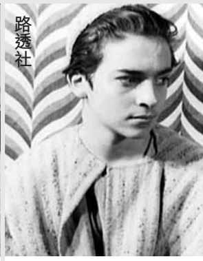
盧密出生自藝術家，自小便開始演戲。