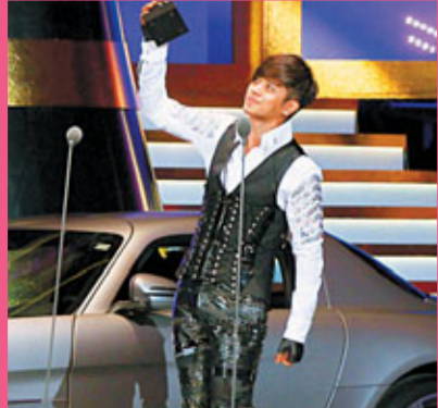
羅志祥獲年度最佳全能藝人等多個獎項，在頒獎典禮上向觀眾致意。