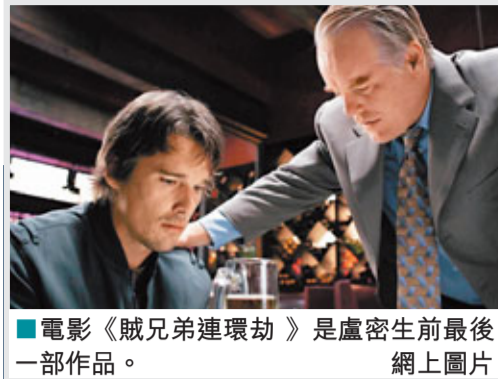
電影《賊兄弟連環劫》是盧密生前最後一部作品。