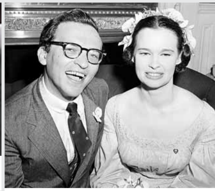
盧密與第二任老婆Gloria Vanderbilt的婚紗照。