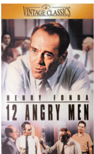
《十二怒漢》是盧密的出道作兼成名作。

盧密是荷里活難得多產的導演，幾乎每年均有新作推出，一生共執導過43部作品，除《十二怒漢》、《電視台風雲》外，《黃金萬兩》、《東方特快列車上的謀殺案》等亦為人津津樂道。盧密病逝前，最後一部執導的作品是07年由菲臘施摩荷夫曼和伊頓鶴基主演的《賊兄弟連環劫》(Before the Devil Knows You're Dead)，該片獲得四項奧斯卡提名。盧密執導的電影先後獲得50多個奧斯卡提名，他個人更五度衝擊奧斯卡最佳導演獎及最佳改編劇本獎，奈何每次均失諸交臂。直到05