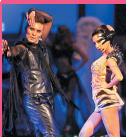
全球流行音樂金榜第1屆頒獎典禮，開場由歌手蔡依林(右)帶領表演動感歌舞。

香港文匯報訊(記者寧寧)「第一屆全球流行音樂金榜」前晚在台北小巨蛋舉行，王力宏、周杰倫兩大才子包辦10項大獎，新力唱片成為最大贏家。