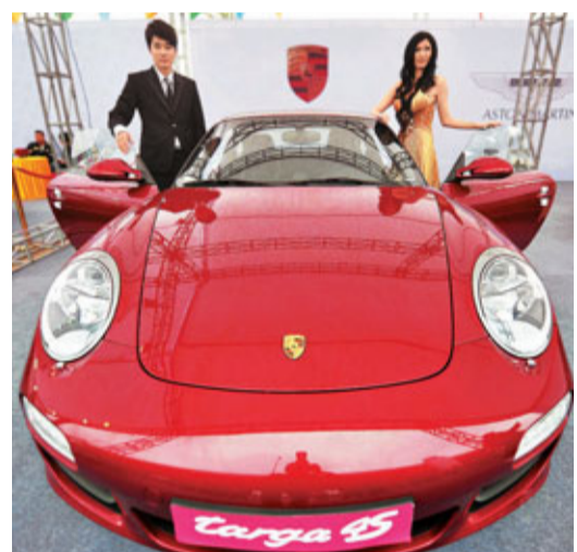
■ 首季汽車進口增加31.8%。

在進口商品中,主要大宗商品呈現「量價齊升」的態勢。其中,鐵礦砂進口1.8億噸,同比增加14.4%,進口均價同比大漲59.5%至每噸156.5美元;大豆進口1,096萬噸,同比基本持平,但進口均價同比上漲25.7%至每噸573.9美元。此外,機電產品進口1,729.2億美元,增長25.6%;其中汽車23.6萬輛,增加31.8%。