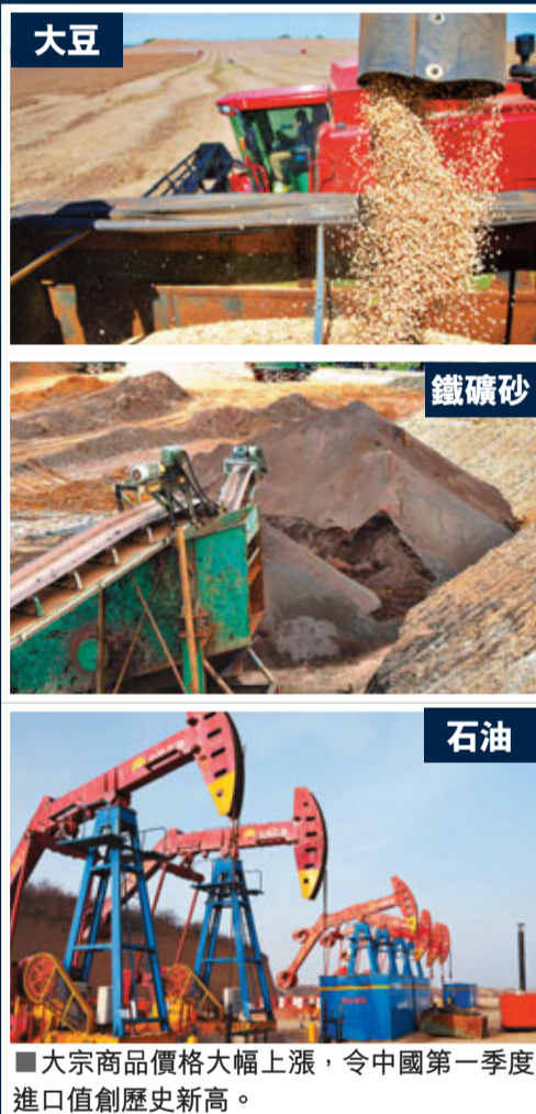
■ 大宗商品價格大幅上漲,令中國第一季度進口值創歷史新高。