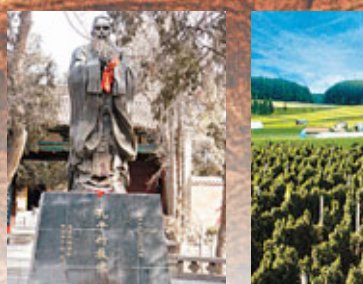
■武威文廟的孔子像