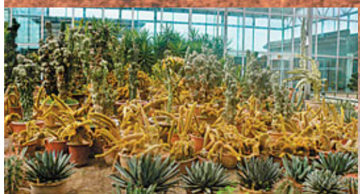
■天乙生態園有溫室種植園，園內的仙人掌千姿百態。