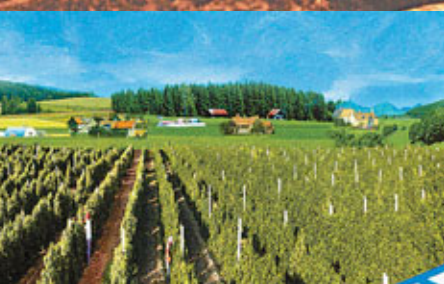
■武威威龍葡萄種植基地