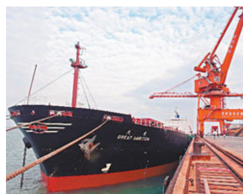
運費成本正在不斷上漲,通脹形勢勢將加劇。資料圖片

香港文匯報訊(記者 涂若奔)對航運公司來說,運費上漲無疑是利好消息,將令公司業績平穩增長。但對普羅大眾而言卻恰恰相反,運費攀升將會推高大宗商品的運輸成本,從而令通脹形勢進一步加劇。有業界人士預料,由於全球主要的糧食船運路線運費將在今年第二季和第三季上漲,下半年包括中國在內的發展中國家可能出現「螺旋式通脹」,中下階層將會百上加斤。