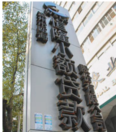
小額貸款公司受浙江民資熱捧。圖為溫州一小額貸款公司。

報告還指出,為浙江小額貸款公司提供貸款的銀行共計15家,其中中國銀行對浙江省小額貸款公司融資貢獻最大,所佔比例最高,達到41.3%,共36.9億元。全年浙江省小額貸款公司年平均貸款利率為17.47%,比上年末增加3.64個百分點;年內最高利率為25.92%;除若干筆具有公益性質的無息貸款外,年內最低利率為4.38%,比上年末增加2.92個百分點。