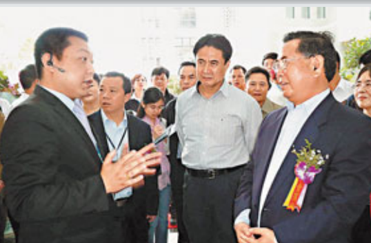
衛留成(右)、羅保銘(中)考察落戶園區的惠普軟件。

香港文匯報訊(記者 何政 邁進報導)已有155家企業落戶,2010年產值達13.8億元人民幣的海南生態軟件園昨舉行開園慶典,揭開了海南省信息產業發展新的一頁。海南省委書記衛留成、省長羅保銘、中國電子信息產業集團董事長熊群力等出席活動。