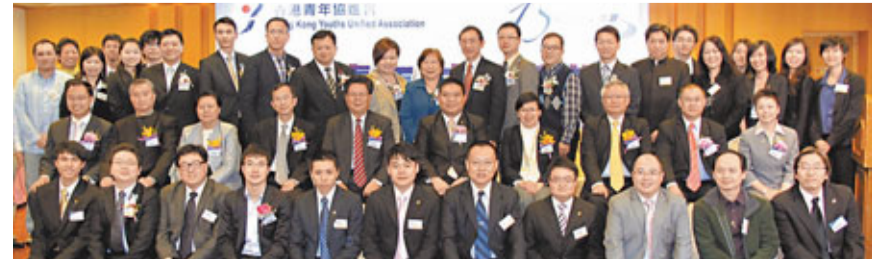
一眾青進理事及傑出服務得獎者上台與嘉賓合照