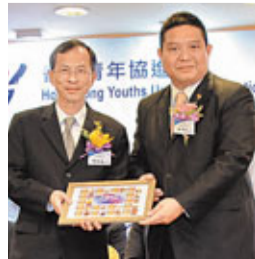
青進主席林亨利致送紀念品予特區立法會主席曾鈺成