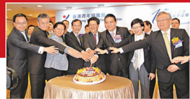
賓主雙方進行會慶切蛋糕儀式

香港青年協進會(青進)日前假尖沙咀香港基督教青年會,舉辦以「凝聚青年,成就夢想」為題的15周年會慶暨青年交流會活動。活動當日,中聯辦副主任周俊明,特區立法會主席曾鈺成,民政事務局副局長許曉暉,全國人大常委徐麗泰,中聯辦九龍工作部巡視員、副部長余汝文,青年事務委員會主席陳振彬等均出席作主禮嘉賓,並與該會當屆主席林亨利,會長楊子熙及逾150名會員共賀該會取得成就及成長歷程。