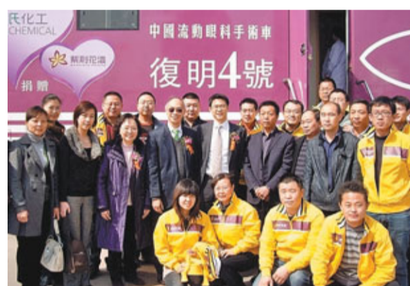
葉氏化工員工與流動眼科手術車合影。