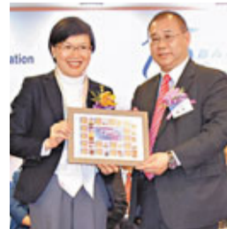
青進永遠會長魏鴻致送紀念品予民政事務局副局長許曉暉