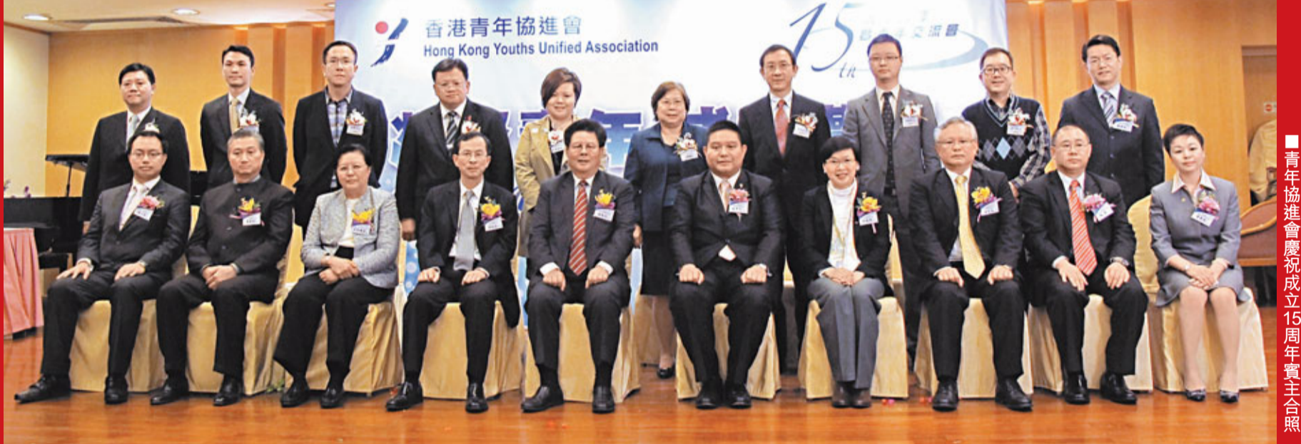
青年協進會慶祝成立15周年賓主合照