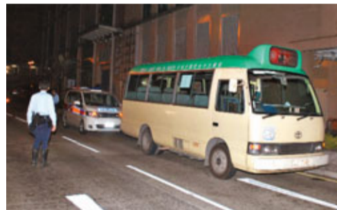
醉漢偷小巴衝燈，警車追截搜武器。

香港文匯報訊 (記者 杜法祖) 一名滿酒身氣巴裔男子，昨凌晨涉嫌在粉嶺一個專線小巴站偷駕一輛小巴，開車期間疑因醉酒伸頭出車窗外嘔吐及衝紅燈，被巡邏警車發現截停，巴漢跳車狂奔百米被警員截停制服，並在身上搜出利刀被捕，送院檢驗後再帶署扣查。