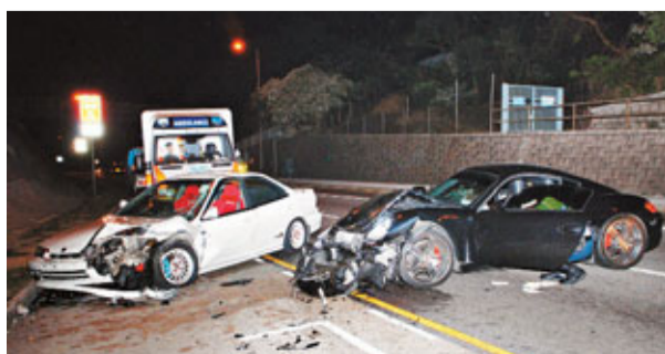
大埔道本跑車與保時捷跑車互撞，俱損毀嚴重。車會，之後一直無供款，車行事後報警；油尖警區重案組第一隊接手調查，去年6月及今年1月先後拘捕1名20歲少女及1名30歲男子，2人俱涉嫌詐騙，暫准保釋候查，並需於4月底及5月初返署報到。但涉案保時捷跑車卻一直未能尋獲，仍被通緝，不料卻在今次車禍中意外尋回，警方正追緝事後逃去的保時捷跑車司機，及了解是否與涉案被捕人士有關。

近年立體動畫技術愈趨成熟，但錢志聰相信不會取代實體模型，因為行動上不可行，「像3D遊戲多玩一會，便會迷失方向，要再看地圖」。警隊訓令支援組歷年傑作還包括2003年屯門公路九巴墮橋意外現場模型、1998年養和醫院洗腎事故等。