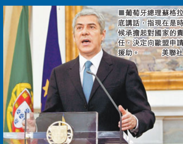
■葡萄牙總理蘇格拉底講話，指現在是時候承擔起對國家的責任，決定向歐盟申請援助。美聯社