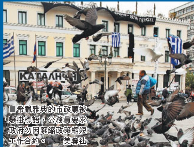
■希臘雅典的市政廳被懸掛標語，公務員要求政府勿因緊縮政策縮短工作合約。