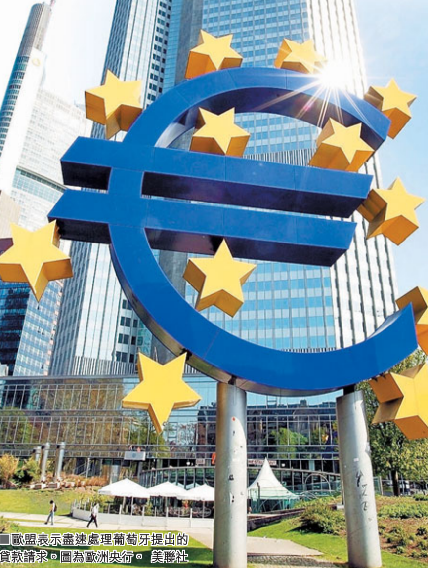
■歐盟表示盡速處理葡萄牙提出的貸款請求。圖為歐洲央行。