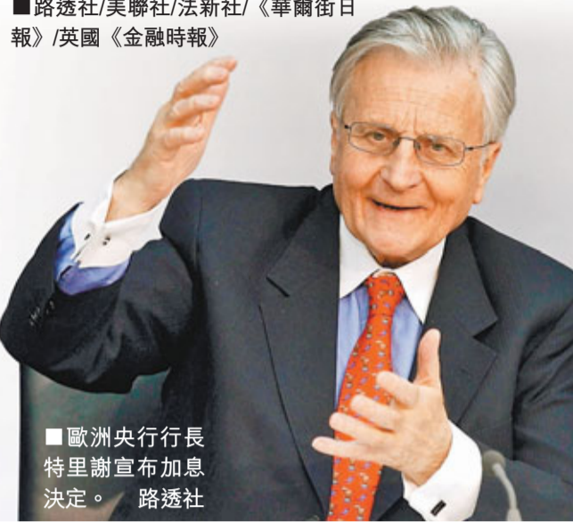
歐洲央行行長特里謝宣布加息決定。