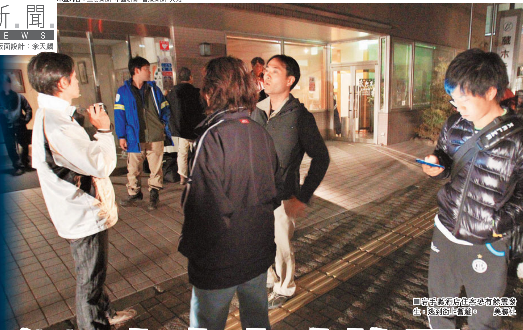
岩手縣酒店住客恐有餘震發生，逃到街上暫避。

日本宮城縣昨晚發生7.4級地震，當局於日本東北地區海岸發出海嘯警報，要求當地居民疏散，前往高處暫避，東北地區大面積停電，宮城縣海岸初步有50厘米海嘯；核電站工人也被下令疏散。日本警察廳表示，地震已造成逾30人受傷。首相菅直人發出指示，要求全力確認受災情況。