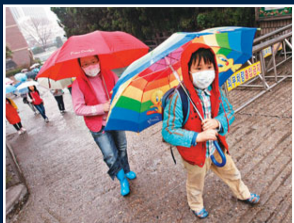
輻射雨引起韓國民眾憂慮，首爾學生放學後打傘回家。

日本核輻射恐慌擴散至韓國。隨著韓國開始普遍降雨，部分地方雨水驗出放射性碘和鈾，儘管濃度極微，但民眾恐慌絲毫未減，不少幼稚園及小學昨日紛紛停課，政府積極採取措施，化解民眾憂慮。人心惶惶之際，不少黑心商人乘機牟利，標榜商品有「防輻射」功效，大發災難財。