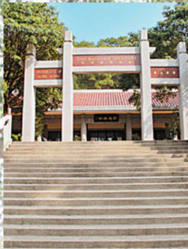
■營地選在遠離城市中心的嘉道理研究所石崗中心

香港文字的傳承或許正該從這「字在山水」開始，推行出無窮無盡的想像力和無限的文字可能。對於可塑性極高的青年一代來說，書寫理應成為他們自發進行自我表達的一種堅持，並將之延續為漫長歲月中最為感性而真摯的集體經驗。