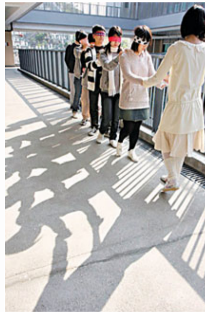
■「筆可能」感官寫作練習