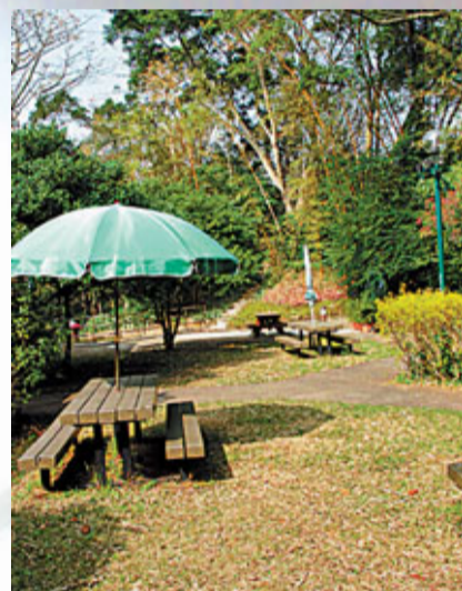
■對自然的觀察力是寫作者之敏銳的一部分