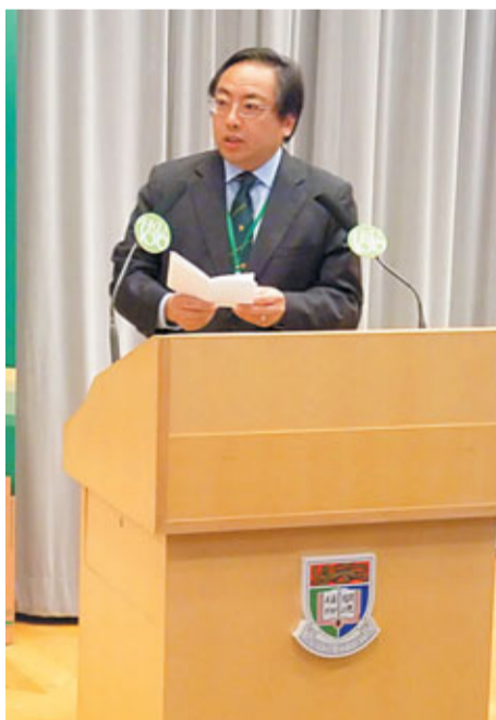
港大校長徐立之認為,現時按學生人頭分配資助的安排,未能令表現出色的院校更出色。