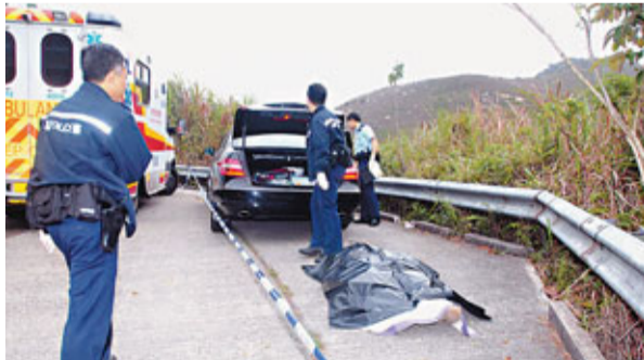
■在屯門菠蘿山一輛平治房車內燒炭自殺男子,被救出時已氣絕身亡。

警員事後在車內發現死者的證件、良景邨寓所的水、電費單及房署信件,以及3封分別給妻子和子女的遺書,內容大意透露受財務問題困擾,警方調查後認為事件並無可疑。