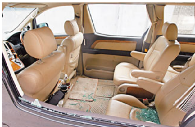
■險再度遇襲兩名義工的座駕被意圖傷人歹徒掛毀車窗玻璃。