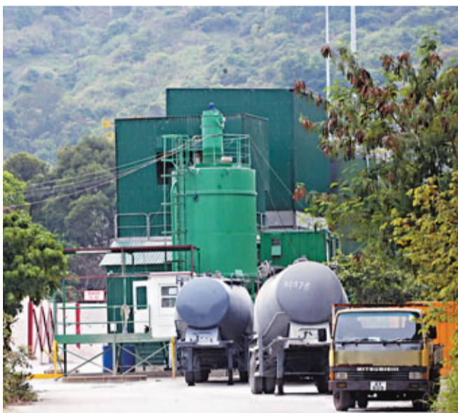
■被指違規的石屎廠繼續無牌運作,田螺車絡繹不絕。

香港文匯報訊(記者 杜法祖)八鄉馬鞍崗村涉無牌偷步經營的石屎廠外,繼上月發生反對該廠經營的義工遇襲事件後,昨晨再發生意圖傷人案。2名上月在村內收集簽名反對該廠開設而遇襲受傷的義工,昨驅車企圖堵塞石屎廠外道路時,突被4名男子駕車從該廠衝出,並圖用木棍和鋤頭襲擊2人,2義工迅開車突圍逃過一劫,但座駕被擊毀,警方事後在橫台山截獲懷疑涉案兇徒所乘汽車,拘捕車上4名男子。案件列作「企圖傷人」案,新界北總區反黑組第2隊已接手深入調查。