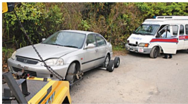
■涉意圖傷人被捕4漢所乘私家車被拖走。