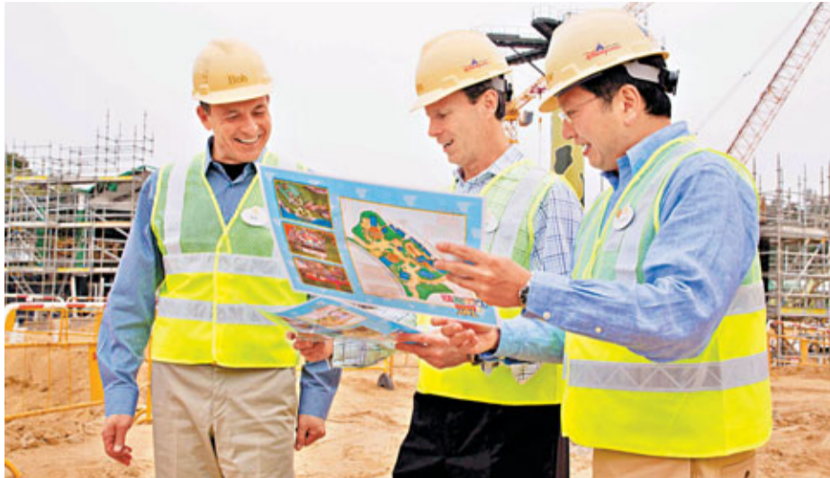
羅伯特·艾格(左)、湯世德(中)與金民豪(右)前往香港迪士尼樂園3個全新主題園區擴建工地了解最新進展。

旅遊業議會主席胡兆英對香港迪士尼擴建工程可望提早開幕感高興,他表示在旅遊業界的角度,更多新景點可增加香港旅遊業的吸引力,帶動更多旅客到訪,業界亦能從中發掘商機。