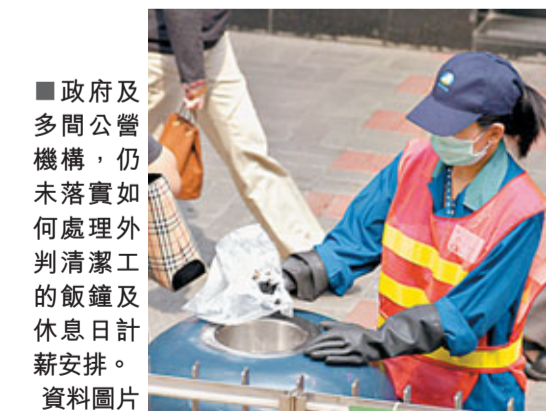
政府及多間公營機構,仍未落實如何處理外判清潔工的飯鐘及休息日計薪安排。資料圖片

香港文匯報訊(記者 文森) 法定最低工資將於下月實施,惟政府及多間公營機構,仍遲遲未落實如何處理外判工的飯鐘及休息日計薪安排。清潔及服務業職工會昨向機管局請願,促機管局維持近400名外判清潔工的合約待遇,提供有薪休息日及飯鐘的安排。工會表示,機管局每年盈利均有增長,有足夠能力為外判工提供有薪飯鐘及休息日,故應樹立良好僱主榜樣。