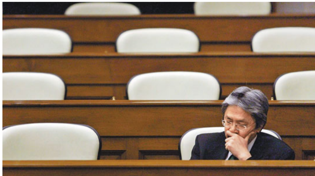
立法會由昨日開始一連兩日辯論預算案，曾俊華在場聽取議員的意見。

香港文匯報訊(記者 鄭治祖)立法會一連兩日就新一份財政預算案恢復二讀辯論，立法會多個主要黨派均歡迎財政司長曾俊華從善如流，順應民意修訂預算案，但認為是次預算案引起社會廣泛爭議，反映當局在諮詢及有關的制訂機制上均有待改進，政府必須汲取教訓，包括多聽取各政黨的意見，以免重蹈覆轍。