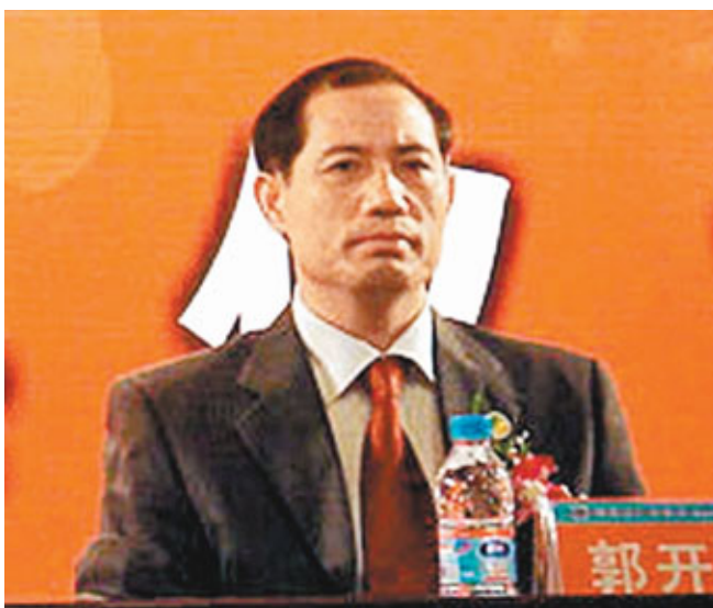
■湖南省副省長郭開朗期望，湖南與意大利高層繼續保持良好的互訪態勢，為湖南企業和遊客赴意投資、旅遊提供更多的便利。

據統計，截至2009年底，意大利在湖南投資項目31個，合同外資4.64億美元，在該省投資經營企業共10家。截至今年1月，湖南共有3家企業在意大利投資，累計合同投資額627.6萬美元。中聯重科2008年通過與其共同投資方出資2.71億歐元收購意大利CIFA公司，令中聯重科成為全球最大的混凝土機械製造企業。