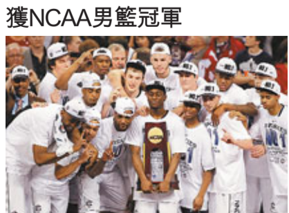
康涅狄格大學獲NCAA冠軍。

第73屆美國大學生體育協會(NCAA)男子籃球決賽4日晚在休斯敦的牛仔體育館舉行。康涅狄格大學隊以53:41戰勝巴特勒大學隊，第三次捧起NCAA男籃冠軍獎盃。