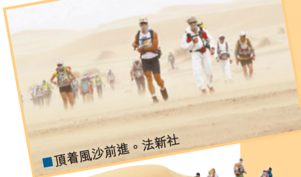
頂着風沙前進。

首屆摩洛哥沙漠馬拉松賽於1986年舉行，當時只有20多人參賽，此後每年舉行一次，目前已舉辦了25屆，參賽人數逐年增加。到本屆賽事之前，已有約1.2萬名選手參賽，其中女性運動員佔14%。