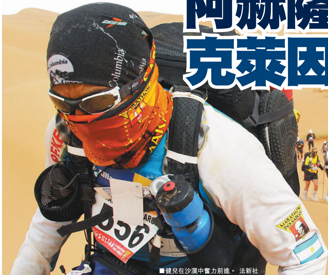
健兒在沙漠中奮力前進。