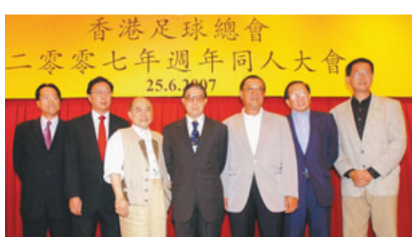
足總首長任期將有改變。資料圖片

香港文匯報訊(記者 潘志南)足總本月14日將舉行特別同人大會，由甲、乙、丙三組共53個有投票權的會員，投票通過修改足總章程。提出修章的主要內容是對會長、主席和執委的任期問題提出新的意見，經過協調後，據悉會章修改後會長、董事、主席任期為4年，會長每屆由會員投票選出，可以連任4屆，即如連任可任16年，而董事會成員、主席任期為4年一屆，最多可連任兩年。