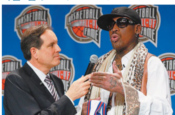
前公牛隊主將洛文登入名人堂。