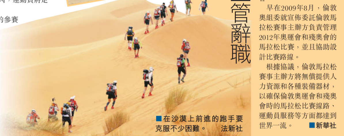
在沙漠上前進的跑手要克服不少困難。