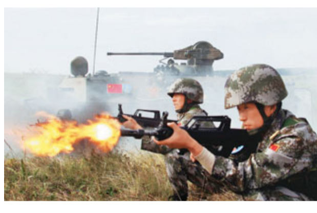
上海合作組織的成員國經常舉辦聯合軍事演習來打擊恐怖勢力。資料圖片

1978年，鄧小平確定中國以經濟建設為中心的道路，提出中國要實現「四個現代化」的目標，包括外交在內的各項活動要服從於中國經濟發展的需要。因此，上海合作組織機制的成立，主要是為給中國創造和平穩定的周邊環境。