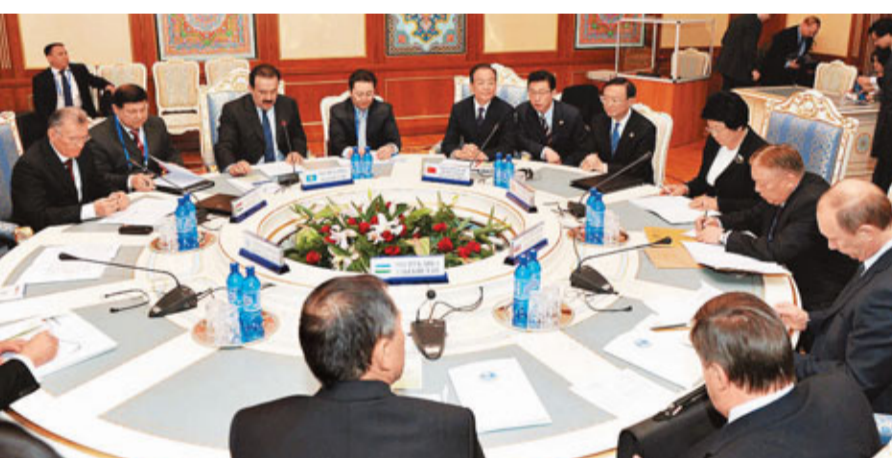
上海合作組織成員國的總理經常會晤交流。資料圖片