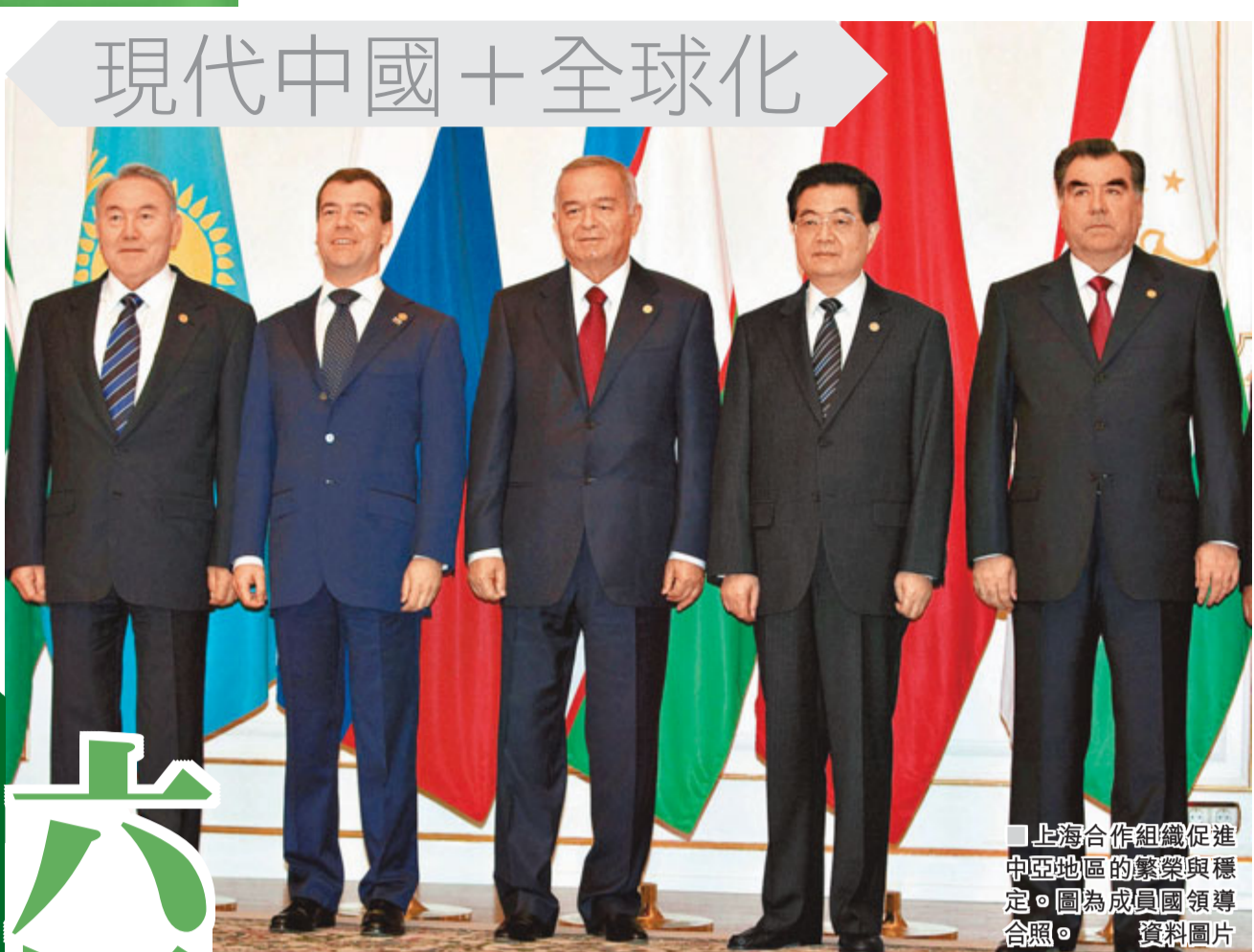
上海合作組織促進中亞地區的繁榮與穩定。圖為成員國領導合照。資料圖片