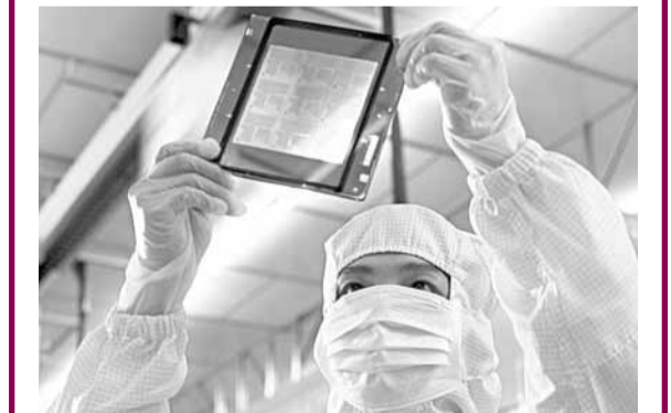
■台灣兩大晶圓晶片大廠，因日震而訂單大增。

據中社5日電 由於日本311大地震後，當地全球前兩大晶圓供應商信越及勝高至今未能復工，台灣兩大晶圓生產商台積電及聯電的客戶近期陸續加碼下單，讓台灣晶圓雙雄第二季接單意外爆滿。