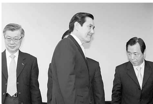
■馬英九(前)親自率領官員舉行記者會，說明「特種貨物及勞務稅」。

如果奢侈稅法案5日在「立法院」財委會獲得通過，月底即可在「院會」完成三讀，7月1日應可如期生效。對此，國民黨團將祭出甲級動員令，不排除挑燈夜戰，