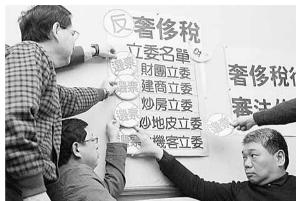
■有民間團體發起監督奢侈稅審議過程，並呼籲選民用選票制裁阻撓立法的立委。

然而這僅僅是財政委員會階段，未來還必須在「立法院」院會開關；在院會二讀過程中，100多位立委很難意