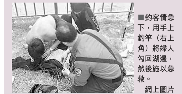
■釣客情急下，用上下釣竿(右上角)將婦人勾回湖邊，然後施以急救。

有釣具業者指出，釣線一磅的力度約0.454公斤，一般專業釣竿使用20磅釣線拉力，要從水中拉動50公斤重的魚應該沒問題；依婦人約五十幾公斤體重加上水浮力，大概只剩約30公斤重，況且婦人沒有掙扎，不像魚會逃脫，拉上岸的成功機率確實很大。