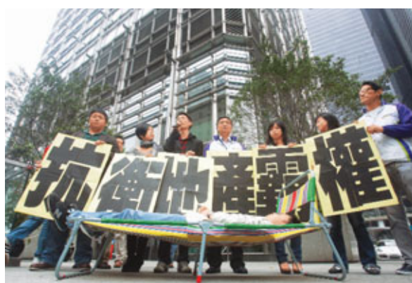
「青年公民」及「關懷香港」昨日轉戰中環，繼續「瞓街」抗議，期間更不惜「報大數」製造民意。