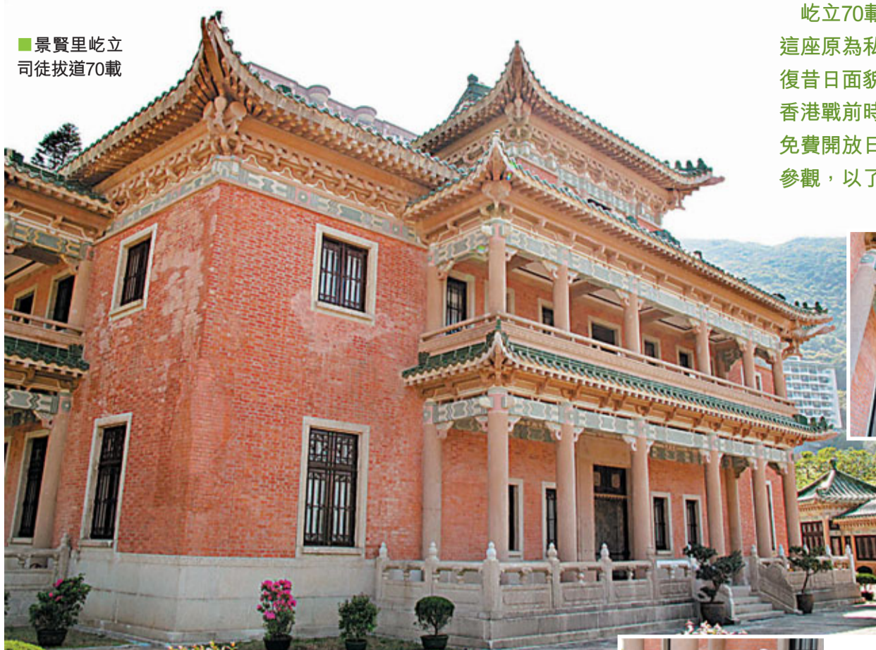
景賢里屹立司徒拔道70載