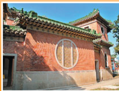
大宅巧妙地糅合中西建築特色