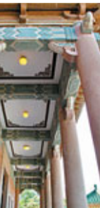
主樓大廳保留原木傢具