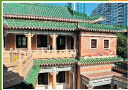
屋頂琉璃瓦片大宅重現中國文藝復興建築風格