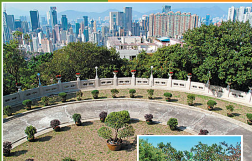
環繞大屋的是一個極大的私人花園