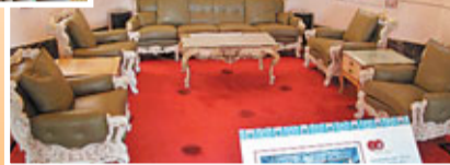
大宅巧妙地糅合中西建築特色