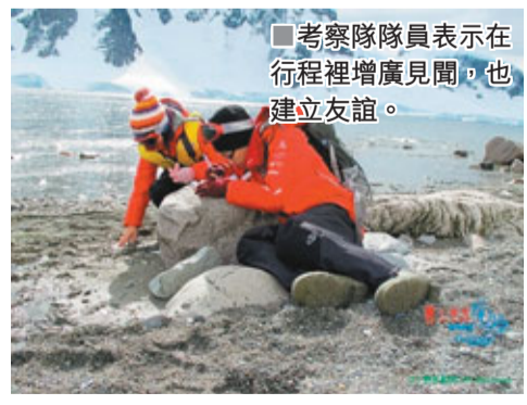
考察隊員表示在行程裡增廣見聞，也建立友誼。

中學生到極地探索自然生態並不是遙遠的事，去年12月便有20個學生到南極考察，搜集資料來撰寫研究題目。說的是參加「仁愛堂·野外長征考察之旅」的20個學生，他們的成行出發亦成了全亞洲首隊中學生組成的考察隊，早前他們更匯報南極的所見所聞，有隊員表示十分珍惜這次18日的南極之行的體驗：「能夠到南極一趟，我這生可說是無憾了。」