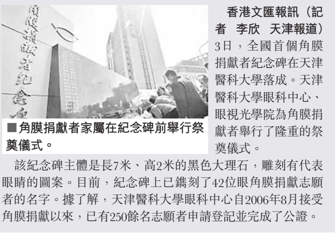
角膜捐獻者家屬在紀念碑前舉行祭奠儀式。

香港文匯報訊（記者 李欣 天津報導）3日，全國首個角膜捐獻者紀念碑在天津醫科大學落成。天津醫科大學眼科中心、眼視光學院為角膜捐獻者舉行了隆重的祭奠儀式。 該紀念碑主體是長7米、高2米的黑色大理石，雕刻有代表眼睛的圖案。目前，紀念碑上已鐫刻了42位眼角膜捐獻志願者的名字。據了解，天津醫科大學眼科中心自2006年8月接受角膜捐獻以來，已有250餘名志願者申請登記並完成了公證。