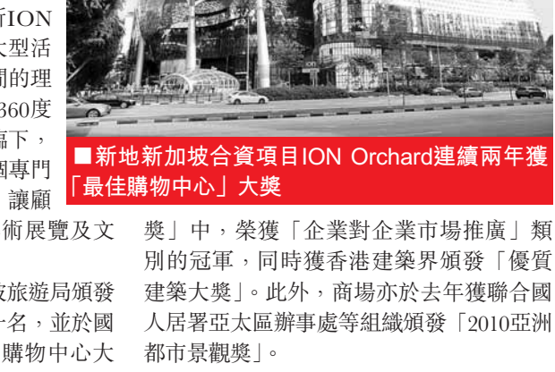
新地新加坡合資項目ION Orchard連續兩年獲「最佳購物中心」大獎

動多媒體幕牆，並設有蓋場所ION Square供公眾使用，既可舉辦大型活動、聚會和慶典，亦是公眾消閒的理想地方。而於今年一月開幕的360度觀景台ION Sky，讓顧客居高臨下，飽覽全市美景；商場並設有一個專門展示藝術作品的ION Art廊，讓顧客在購物之餘可以欣賞各種藝術展覽及文化活動。 ION Orchard 於去年獲新加坡旅遊局頒發2010年「最佳購物體驗獎」第一名，並於國際購物中心協會主辦的「亞洲購物中心大