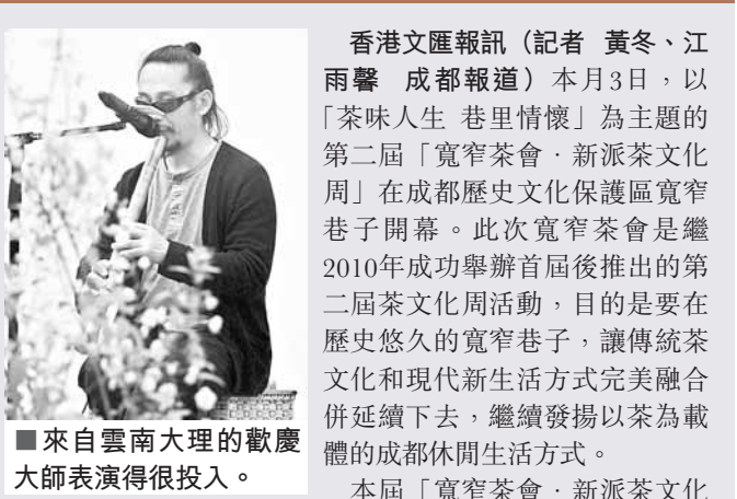
來自雲南大理的歡慶大師表演得很投入。

香港文匯報訊（記者 黃冬、江雨馨 成都報導）本月3日，以「茶味人生 巷里情懷」為主題的第二屆「寬窄茶會·新派茶文化周」在成都歷史文化保護區寬窄巷子開幕。此次寬窄茶會是繼2010年成功舉辦首屆後推出的第二屆茶文化周活動，目的是要在歷史悠久的寬窄巷子，讓傳統茶文化和現代新生活方式完美融合併延續下去，繼續發揚以茶為載體的成都休閒生活方式。 本屆「寬窄茶會·新派茶文化周」將持續一周，期間寬窄巷內多家以茶為主題的院落商家將相繼推出不同的茶味生活體驗及分享活動，讓人們在寬窄巷子不僅能領略到傳統茶文化與新生活方式的完美融合，同時還能體會到品茗的不同樂趣。 在開幕式上，為了突出茶文化的精髓，特別推出了一台原生態表演的節目。看茶道表演，賞部落鼓舞，聽羌族姑娘合唱，觀彝族歌舞，以及從雲南大理遠道而來的歡慶大師帶來的大理原生態歌舞。在春日暖陽下，看一齣別致的茶文化原生態表演，品一杯香茗，可以讓你感受到寬窄巷子濃厚的文化底蘊和愜意的生活。