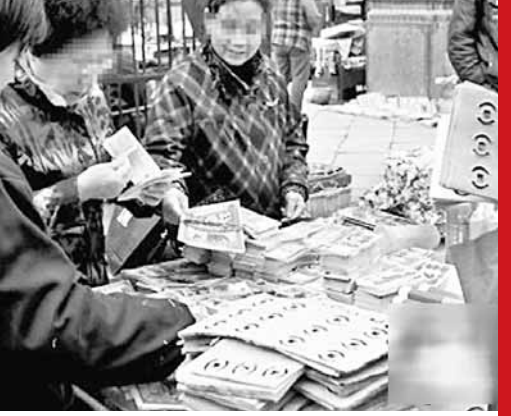
清明節買冥幣燒給先人是民間傳統的祭祀方式。

每逢清明節，焚燒冥幣是民間祭奠親人的方式之一。近日，位於西安市城東八仙庵附近的王姓冥幣批發商透露，自己每年大約能賣出60萬公斤（600噸）冥幣，淨利潤40餘萬元。據了解，在西安，這樣的批發商有十來個人。以此計算，西安地區每年用作冥幣而燒掉的紙張就超過6千噸。