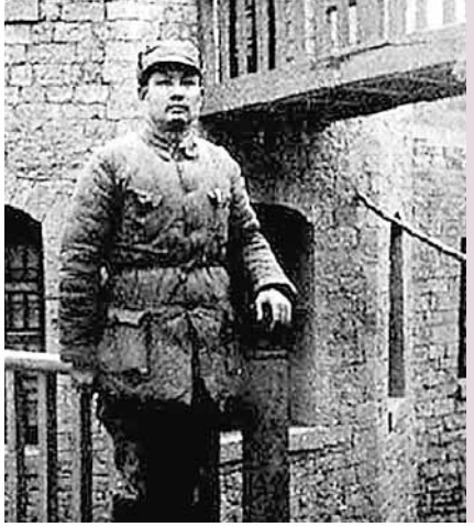
葉劍英在抗戰時期。

當然，樂申這邊選好了，也要看「猩女郎」的態度。對此，園方「口風很緊」，因為紅猩猩數量太少，適齡的母猩猩就更少了，好多家動物園都想「搶腥」。園方準備等到手續辦妥了，立即去迎親。「我們想把這場婚事辦得熱鬧開闢的，」園方負責人說，到時候還打算面向社會徵集組織一個迎親車隊，一起浩浩蕩蕩去接新娘子。當然，數量也不能太多，初步的想法是：樂申12歲，最多組織12輛車。 ■《揚子晚報》