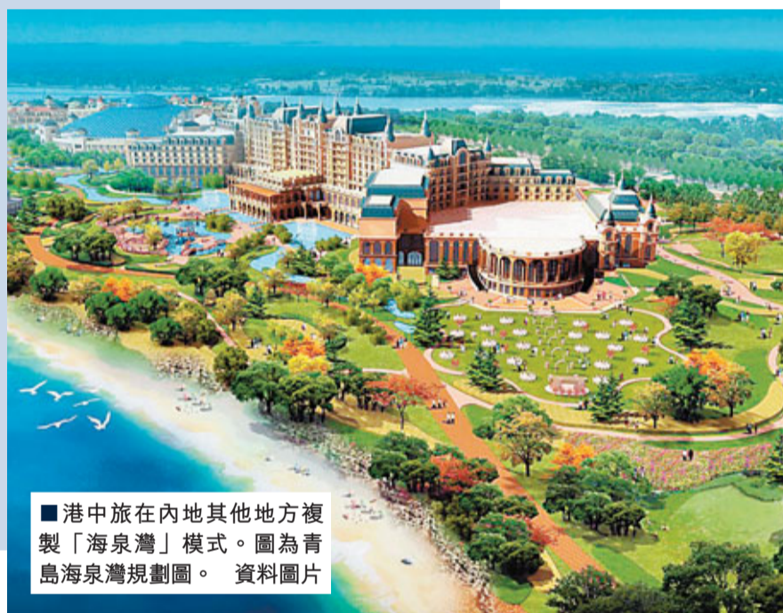
港中旅在內地其他地方複製「海泉灣」模式。圖為青島海泉灣規劃圖。資料圖片