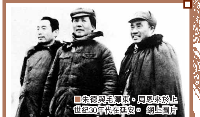
朱德與毛澤東、周恩來於上世紀30年代在延安。