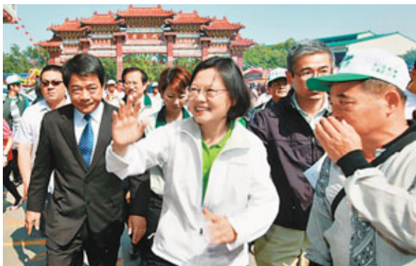
■蔡英文(前中)日前前往台南市麻豆區代天府參拜。