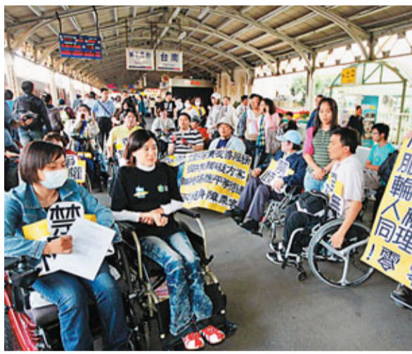
■10多名身障者3日齊集台南火車站抗議。

喊出「新世代」的蔡英文，也不忘尋求傳統宗教界支持。上個月她宣布參選隔兩天，立即回老家屏東參拜潮州三山國王廟、竹田忠義祠；日前也在藍營色彩濃厚的木柵指南宮獲得廟方力挺。蔡陣營發言人徐佳青表示，