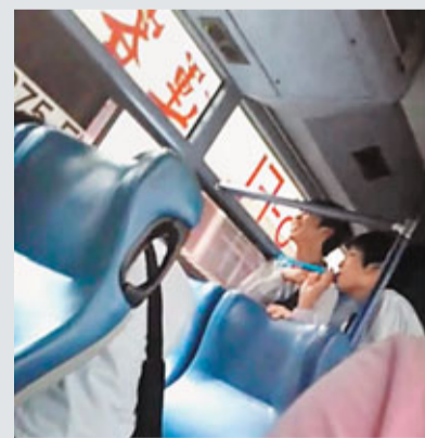
■高中生在公車上，以吸管朝外「吐珠」。

據台灣TVBS報導，桃園有3名高中生，在回家的客運公車上，拿著買來的珍珠奶茶當彈藥，用吸管朝車外無辜的機車騎士和路人噴射，還嘻嘻哈哈指指點點。剛好坐同一班公車的網友，把過程全都PO上網。有網友批評，這樣的惡作劇實在太可惡了！