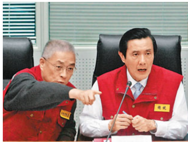
■台媒引述消息指，「馬吳配」的呼聲高。資料圖片 「總統」，須完成百分之五黨員連署，此一門檻不低，出現第二組人馬機會不大；馬英九可望直接獲黨內提名，隨後副手卡位戰就會白熱化。

國民黨已啟動正副「總統」黨內初選機制，馬英九本週四或週五將委託幕僚領表並繳交200萬元台幣（約54萬港元）保證金，月底登記成為候選人。黨內主管解釋，如無其他人選登記，最快5月4日報請中常會通過提名。完成提名程序後，國民黨前秘書長金溥聰領軍的馬英九競選辦公室也將展開運作，正式拚戰2012。 黨務主管也說，黨內若有他人領表，依規定非現任