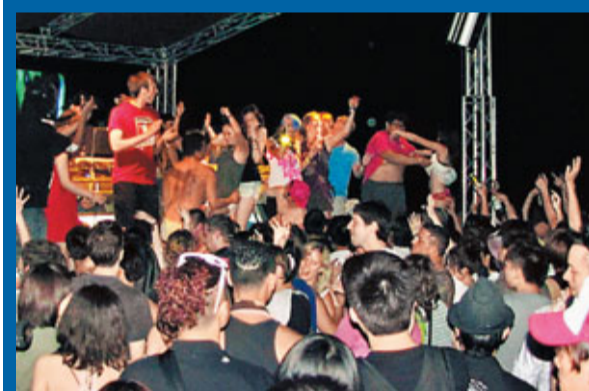
■音樂會吸引不少各國樂迷參與。