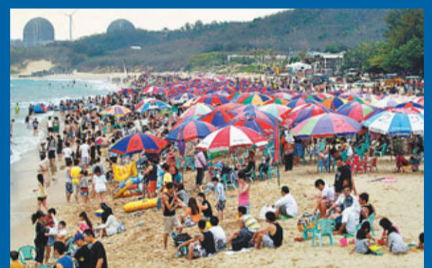
■墾丁春天音樂季為南灣沙灘引入人潮。