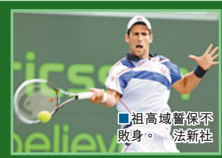
■祖高域誓保不敗身。

拿度則於4強以6:3及6:2再次擊敗費達拿,對於外界質疑「王朝不再」,「費天王」賽後澄清自己依然有心有力:「我仍然很期待將來的比賽,雖然大家的質疑令我感到自己好像已是35歲一樣,但我還只是29歲,依然可以再打幾年。」