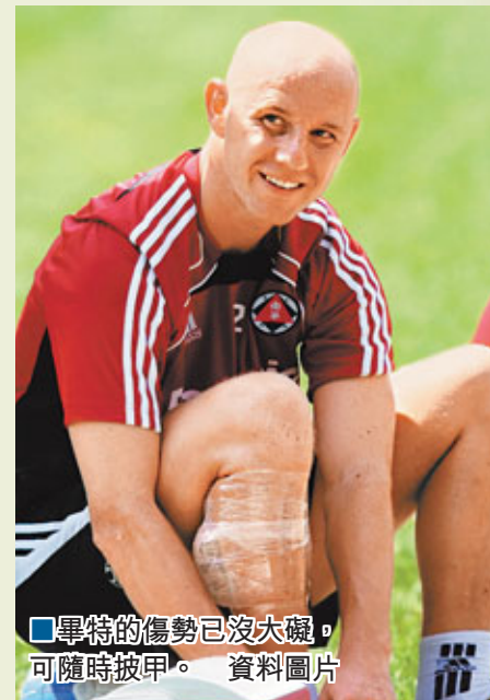
■畢特的傷勢已沒大礙,可隨時披甲。