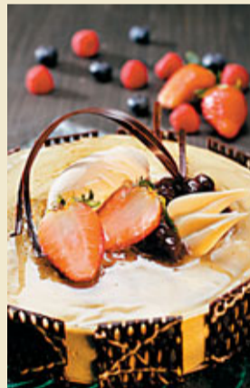
■和式綠茶紅豆慕士餅

LIS Bar & cafe 查詢電話：(852) 3968 8833 地址：香港香港仔黃竹坑道55號 南灣海景酒店P3 (消費可享免費泊車)