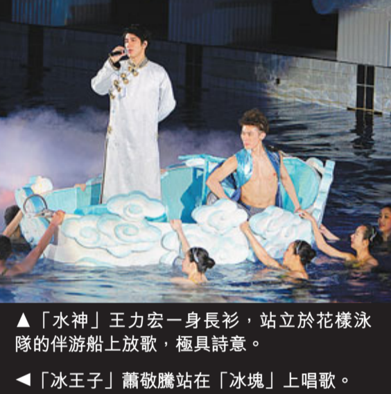
「水神」王力宏一身長衫，站立於花樣泳隊的伴游船上放歌，極具詩意。

四歌手分別被安排不同角色，飾演冰王子的蕭敬騰打頭陣，成功克服畏高在十米高台上高歌表演，讓大家看得觸目驚心；仙子李宇春在漫天飄雪下，以勁歌熱舞，散發無窮熱力；陳奕迅一身火辣紅衣裝束的火神打扮，由台前走進一個由高科技特製的隱形舞台上，水中漫步熱唱，唱至興起，連唱畢返回後台時也蝦碌走錯路，十分搞鬼；水神王力宏身穿Bling Bling中國長衫，閃爆全場，自彈自唱置身花樣泳隊的伴游船上，逍遙