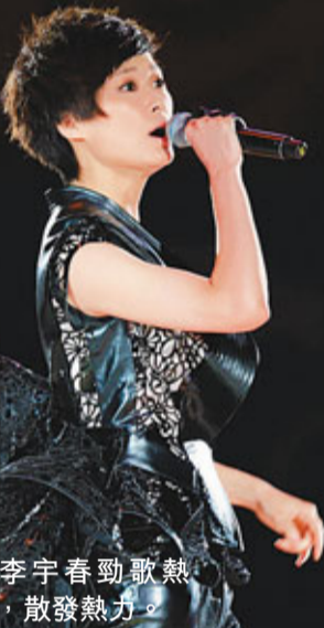
李宇春勁歌熱舞，散發熱力。

香港文匯報訊(記者寧寧)人氣歌手王力宏、陳奕迅、李宇春、蕭敬騰前晚在北京水立方參與一眾國家泳手參加多媒體慈善音樂騷「非凡之旅」演出，四位歌手在一班出色的國家跳水和花式泳隊的精彩表演穿插下，施展渾身解數，讓觀眾看得目不暇給。