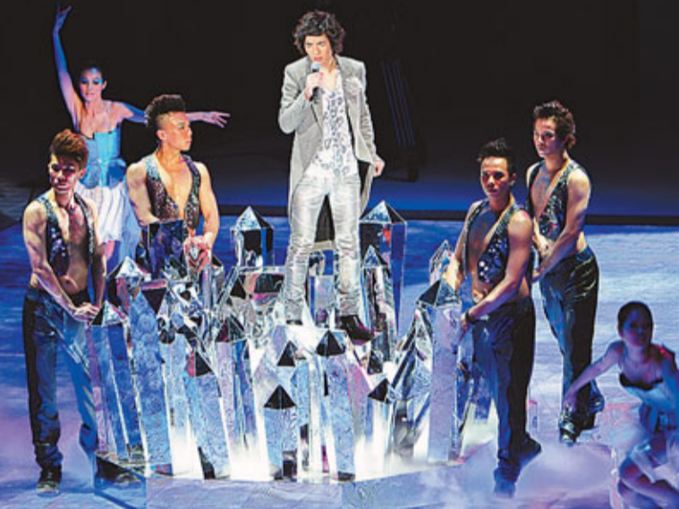
「冰王子」蕭敬騰站在「冰塊」上唱歌。