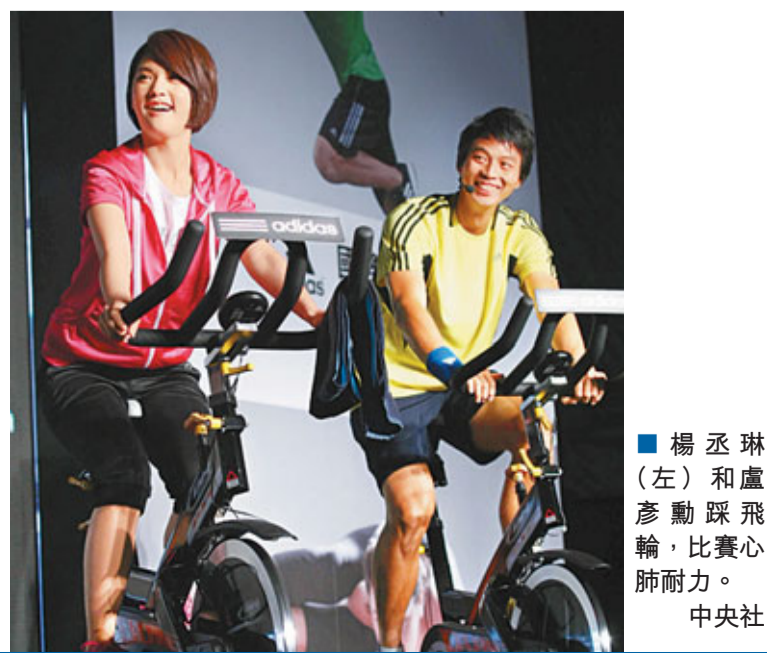
楊丞琳(左)和盧彥勳踩飛輪，比賽心肺耐力。

見到台灣網球一哥盧彥勳，楊丞琳說，盧彥勳很帥，不過在後台不太敢跟盧彥勳說話，「因為他真的像球王的那種氣勢。」而盧彥勳平常從電視上看楊丞琳演的戲劇，他也稱讚楊丞琳漂亮、個性隨和。去年底結婚的盧彥勳送楊丞琳護腕，祝福她也能趕快找到另一半，讓台下的粉絲尖叫聲連連，楊丞琳則以擁抱，希望他比賽成績能越來越好。