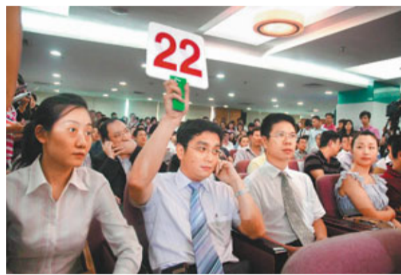
■由於國家調控,導致企業銷售不好,銀行信貸規模縮減等,影響了開發商投地的熱情。

北京大學公共經濟研究中心研究員韓世同認為,土地底價成交應該是市場進入低迷的一個信號,近期全國各個城市都出現了流拍。由於國家調控,樓市成交萎縮嚴重,雖然房價沒有大幅度降價,但從這個勢頭來看,前景未必樂觀。從上市房地產企業公佈的2010年業績看,房企業績已開始分化。而企業銷售不好,銀行信貸規模