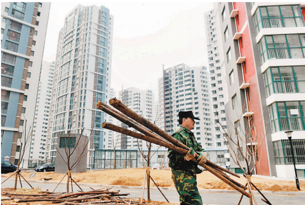
■截至3月31日,全國657個城市中,已有608個公佈年度新建住房價格控制目標。圖為山東青島一棟即將竣工的保障房。

曾將房價控制目標定為增幅低於50.5%而名聲大噪的樹輸,近日將目標調整為「新建住房價格(均價)增幅控制在10%以內,低於2011年城鎮居民人均可支配收入增幅。」而貴陽市也在近期將2月份公佈的「新建住房價格增幅不低於去年全國平均值」,調整為「2011年貴陽市新建住房價格上漲幅度控制在本年度全市生產總值和城鎮居民人均可支配收入增幅以內,新建住房價格增幅不低於去年全國平均值」。