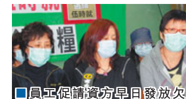
員工促請資方早日發放欠薪。

件，共接獲64名員工的求助個案。勞工處已在上月17日安排勞資雙方調解會議，僱主表示無能力支付欠薪。勞工處已安排求助人員本月初到勞資審裁處，為員工申請破產欠薪基金。勞工處表示已向僱主說明，蓄意逃避支薪刑責問題，會繼續跟進，如發現有蓄意違反條例，會作出檢控。