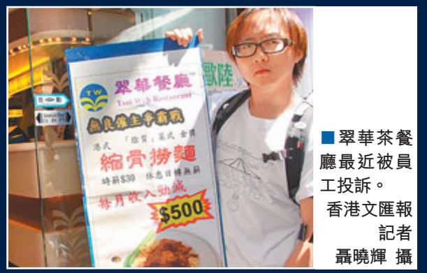
翠華茶餐廳最近被員工投訴。

翠華集團昨日發表聲明指，如果員工不接納新合約，所有薪酬福利將按照原有合約條件發放，並會確保符合最低工資要求。聲明又表示，集團早前已成立小組處理最低工資。小組建議，集團保留月薪制，以及把休息日訂為無薪，但必須確保員工收入不會因新方案減少。小組又指，已作出年度薪金調整，加薪幅度3.9%；下月將推出獎金制獎勵員工。集團表示，方案已獲得大部分員工支持，並願意簽署新合約。