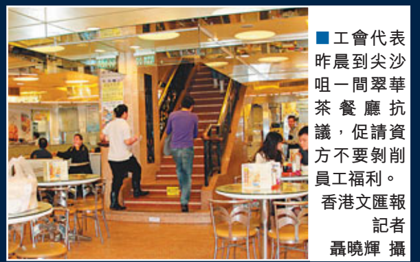
工會代表昨晨到尖沙咀一間翠華茶餐廳抗議，促請資方不要剝削員工福利。