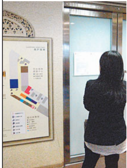
「奇妙姻典證婚中心」突然倒閉。

香港文匯報訊 (記者 陳寶瑤) 證婚行業近年大行其道，並進入次弱留強局面。倘光顧的公司突然結業，準新人隨時「喜事」變「愁事」。日前，位於旺角始創中心的「奇妙姻典證婚中心」突然倒閉，業主在門外張貼通告指，該公司拖欠20萬元租金及管理費，被申請清盤。警方接到27人報案求助，料200人受影響。消委會則接獲4宗相關投訴，涉及2.3萬多元。有證婚公司負責人指出，證婚公司開業門檻低，但行業競爭大，當遇上淡季，往往無法支撐；建議消費者光顧大型及有口碑的商號，以及留意合約條款。突然結業的「奇妙姻典證婚中心」