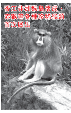
香江非洲猴島落成，赤猴等各種珍稀猴類首次展出