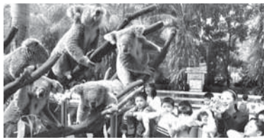
考拉成為女性的最愛