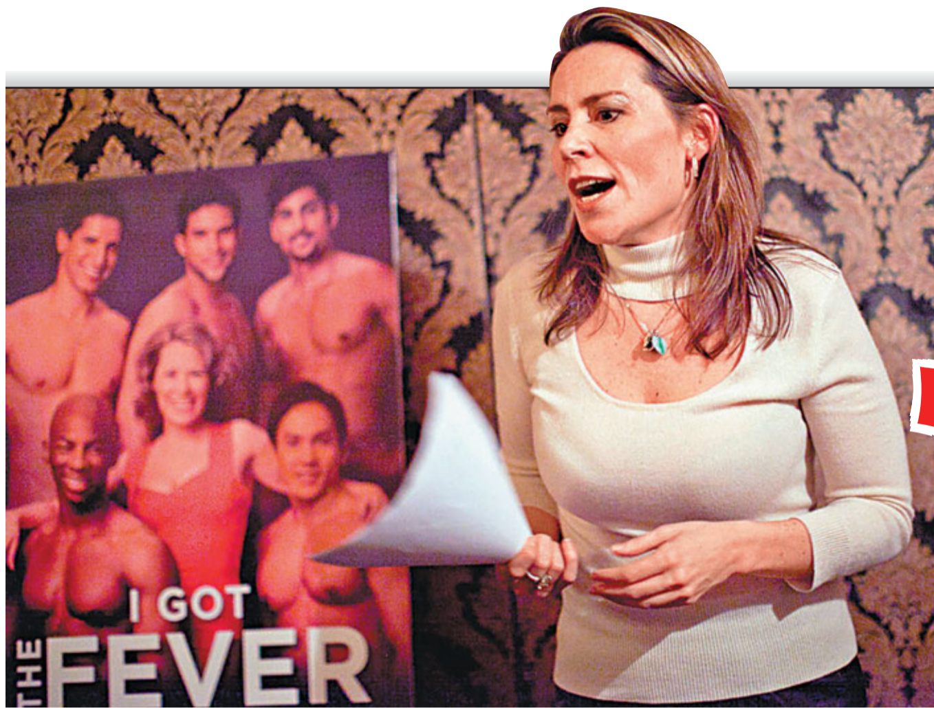
戴維斯原是成功女性。