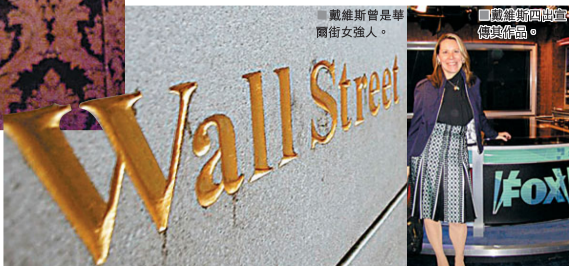
戴維斯曾是華爾街女強人。